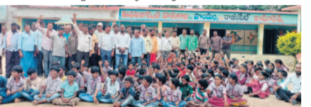
నివాదాలు చేస్తున్న పొందర్ ప్రాథమికోన్నత పాఠశాల విద్యార్థులు, గ్రామస్థులు

రాజంపేట్, జూలై 8 : ఉపాధ్యాయుల బదిలీ ఏమో కానీ కొన్ని ఉదంతాలు బాగా చర్చనీయాంశమవుతున్నాయి.