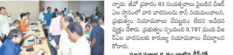
ఫిర్యాదులు స్వీకరిస్తున్న అదనపు కలెక్టర్లు, అధికారులు

కంఠేశ్వర్, జూలై 8 : జిల్లాకేంద్రంలోని కలెక్టర్లలో సోమవారం నిర్వహించిన ప్రజావాణి కార్యక్రమానికి 105 ఫిర్యాదులు వచ్చాయని అధికారులు తెలిపారు.