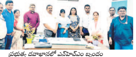
ప్రభుత్వ దవాఖానలో ఎన్హెచ్ఎం బృందం