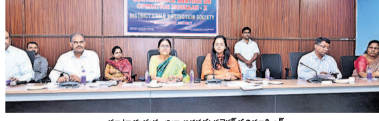
మాట్లాడుతున్న జిల్లా అదనపు కలెక్టర్ ప్రతిమాసింగ్

రంగారెడ్డి, జూలై 8 (నవస్త తెలంగాణ) : 14 సంవత్సరాల పిల్లలను, మైనర్లను పనిలో పెట్టుకుంటే ఆయా యజమాన్యాలపై క్రిమినల్ కేసులు నమోదు చేసి చట్టపరమైన చర్యలు చేపట్టడం జరుగుతున్నదని జిల్లా అదనపు కలెక్టర్ ప్రతిమాసింగ్ పోలీస్ స్టేషన్లలో విస్తృతంగా పర్యవేక్షించాలన్నారు. సోమవారం సమీకృత జిల్లా కార్యాలయాల సముదాయ భవనంలోని సమావేశ మందిరంలో జిల్లా సంక్షేమ శాఖ అధ్యక్షులతో జిల్లా నిర్వహించిన ఆపరేషన్ మున్సిపల్ సమావేశంలో జిల్లా అదనపు కలెక్టర్ ముఖ్యఅతిథిగా పాల్గొని మాట్లాడారు. ఆపరేషన్ మున్సిపల్ జూలై 1 నుంచి 31 వరకు నిర్వహించనున్నట్లు తెలిపారు. తప్పిపోయిన పిల్లలను గుర్తించి తల్లిదండ్రులకు అప్పగించనున్నట్లు పేర్కొన్నారు. 14 ఏళ్ల లోపు బిచ్చులు చదువుకునేందుకు బదుల్లో ఉండాలి తప్ప పనిలో ఉండకూడదన్నారు. ఆపరేషన్ మున్సిపల్ పట్టు