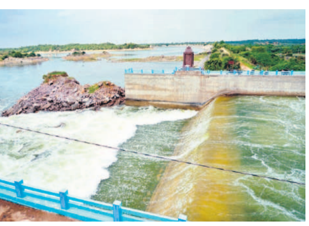
గుడిపల్లి రిజర్వాయర్ కు పారుతున్న నీళ్లు