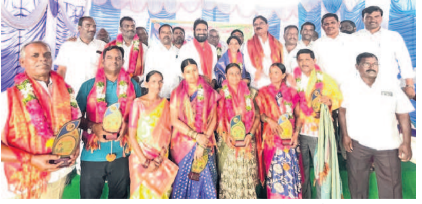
తాజా మాజీ మండల పరిషత్ సభ్యులను సన్మానిస్తున్న మాజీ మంత్రి శ్రీనివాస్ గౌడ్

పాలమూరు, జూలై 9 : కాంగ్రెస్ ఎన్నికలకు ముందు ఇచ్చిన ఆరు గ్యారెంటీల అమలు అసాధ్యమని, ఇది తెలిసి బ్రింఫాన్ రాజకీయాలు చేస్తున్నారని మాజీ మంత్రి శ్రీనివాస్ గౌడ్ మండిపడ్డారు. మహబూబ్ నగర్ రూరల్ మండలం అభివృద్ధిలో ఇటీవల పదవీకాలం పూర్తి చేసుకున్న మహబూబ్ నగర్ మండలం పరిషత్ సభ్యులను మంగళవారం సన్మానించారు. ఈ సందర్భంగా ఆయన మాట్లాడుతూ.. కాంగ్రెస్ ఇచ్చిన హామీలను అమలు చేయకుండా.. పదేండ్ల తెలంగాణ అన్నిరంగాల్లో అభివృద్ధి పనులకు నిడదర్లు లేకుండా బీఆర్ఎస్ అధికారులు చేయడమే పనిగా పెట్టుకున్నారన్నారు. ప్రజలు ప్రభుత్వ తీరును గమనిస్తున్నారని, తగిన సమయంలో సమాధానం చెప్పారన్నారు. మోసపూరిత వ్యాపారాల అధికారంలోకి వచ్చి పాలన చేత