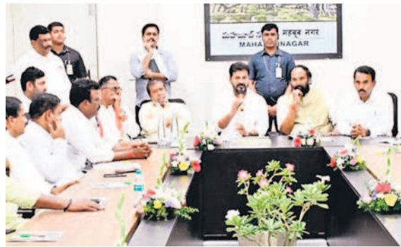
సమీక్ష సమావేశంలో మాట్లాడుతున్న సీఎం రేవంత్ రెడ్డి