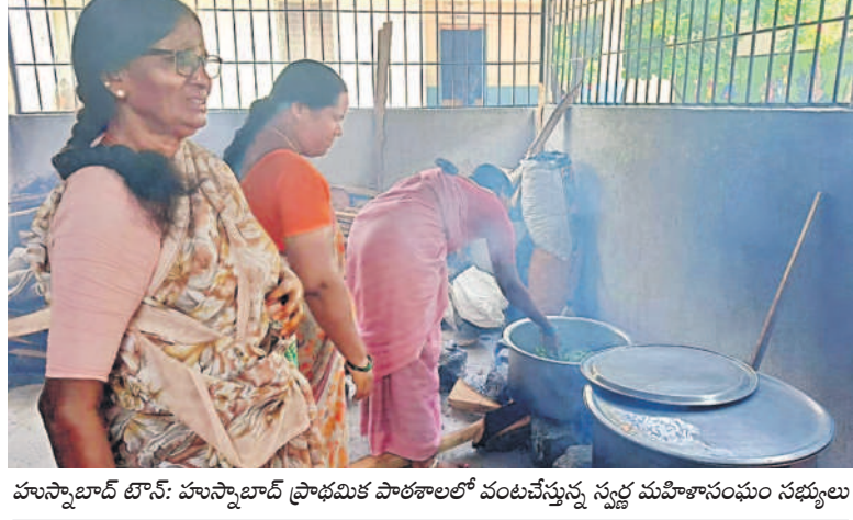
హుస్సాబాద్ టౌన్: హుస్సాబాద్ ప్రాథమిక పాఠశాలలో వంటచేస్తున్న స్వల్ప మహిళా సంఘం సభ్యులు