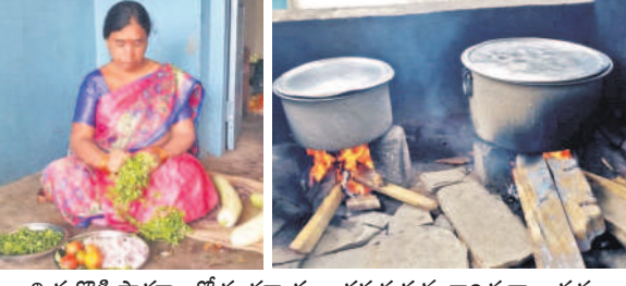
మిరుద్దొడ్డి పాఠశాలలో కూరగాయలు తరుగుతున్న కార్యకర్తలు పచ్చి, విద్యార్థులకు ఆహారం సిద్ధం చేస్తున్న మధ్యాహ్న భోజన కార్యకర్తలు

న్నారు. 2024 జనవరి, ఫిబ్రవరి, మార్చి, ఏప్రిల్, జూన్లకు సంబంధించి వేతనాలు పెండింగ్లో ఉన్నాయి. 9, 10వ తరగతి మధ్యాహ్న భోజన బిల్లులు 2024 జనవరి నెలలో వచ్చాయి. ఫిబ్రవరి, మార్చి, ఏప్రిల్, జూన్ నెలల బిల్లులు పెండింగ్లో ఉన్నాయి.1నుంచి 8వ తర