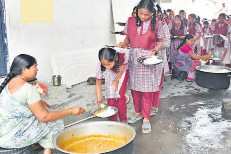
సిద్దిపేట ప్రభుత్వ బాలికల ఉన్నత పాఠశాలలో విద్యార్థులకు భోజనం పెడుతున్న నిర్వాహకులు