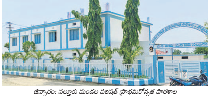
జిన్నారం: నల్లూరు మండల పరిషత్ ప్రాథమికోన్నత పాఠశాల

జిన్నారం, జూలై 9 : ప్రభుత్వ పాఠశాలలకు ఉచిత కరెంట్ ఇస్తామని సీఎం రెవెంయూ డివిజన్ ప్రకటించినా ఇప్పటికీ అమలు కావడం లేదు. ఉచిత కరెంట్ సరఫరా మండల విద్యక్షాభి అధికారులకు, ఉపాధ్యాయులకు అలాగే టిఫిన్ ఎలాంటి ఆదేశాలు రావలసివచ్చాయి. కుక్క కం హెల్మర్లకు రావాల్సిన గౌరవ వేతనం గురించి ఆరోగ్య సమస్యలు ఎదురవుతున్నాయి. మరో ట్రైకిఫ్యాన్స్ పెట్టాలి.