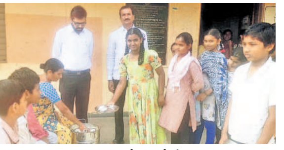
నర్సాపూర్ జిల్లా పరిషత్ పాఠశాలలో గతంలో ట్రైకి ఫ్యాన్స్ పెడుతున్న హెల్మర్

విన వేతనాలు పెండింగ్లో ఉన్నాయి. 5 నెలల నుంచి మధ్యాహ్న భోజన కార్యకర్తలకు హామీ ప్రకారం ప్రభుత్వం మధ్యాహ్న భోజన కార్యకర్తలకు నెలకు రూ.10వేల వేతనం అమ్మాయిల ద్వారా అప్పులు చేసి భోజనం పండిపెడుతున్నామని ఆవేదన వ్యక్తం చేశారు. తెచ్చిన అప్పులకు వడ్డీలు కట్టలేక ఆర్థికంగా ఇబ్బందులు ఎదుర్కొంటున్నట్లు తెలిపారు. ఇప్పటికే చెల్లించాల్సిన బిల్లులు సైతం పెండింగ్లో ఉన్నాయి. నెలకు తరబడి బిల్లులు రాకపోవడంతో అప్పులు చేసి భోజనం పండిపెడుతున్నామని ఆవేదన వ్యక్తం చేశారు. తెచ్చిన అప్పులకు వడ్డీలు కట్టలేక ఆర్థికంగా ఇబ్బందులు ఎదుర్కొంటున్నట్లు తెలిపారు. ఇప్పటికే చెల్లించాల్సిన బిల్లులు సైతం పెండింగ్లో ఉన్నాయి. నెలకు తరబడి బిల్లులు రాకపోవడంతో అప్పులు చేసి భోజనం పండిపెడుతున్నామని ఆవేదన వ్యక్తం చేశారు. తెచ్చిన అప్పులకు వడ్డీలు కట్టలేక ఆర్థికంగా ఇబ్బందులు ఎదుర్కొంటున్నట్లు తెలిపారు.