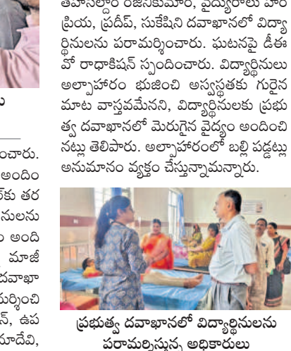
ప్రభుత్వ దవాఖానంలో విద్యార్థులను పరమర్శిస్తున్న అధికారులు