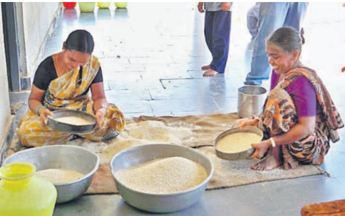
రామాయంపేట పాఠశాలలో బియ్యంలో మెరిగలు తీసివేస్తున్న కార్యకర్తలు

మెడక్, జూలై 9 (నమస్తే తెలంగాణ): మెడక్ జిల్లాలో 871 పాఠశాలలు ఉన్నాయి. ఇందులో ప్రాథమిక పాఠశాలలు 607, యూపీ ఎన్ 124, జూనియర్ హైస్కూళ్లు 140 ఉన్నాయి. 65,610 మంది విద్యార్థులు విద్యనభ్యసిస్తున్నారు. వీరికి మధ్యాహ్న భోజన కార్యక్రమాల ప్రతిరోజూ మధ్యాహ్న భోజన పథకం కింద భోజనాన్ని మెన్యూ ప్రకారం అందిస్తున్నారు. మధ్యాహ్న భోజన నిర్వాహకులకు పెండింగ్ వేతనం, బిల్లులు, గుడ్డు బిల్లులు రాకపోవడంతో ఇబ్బందులు ఎదుర్కొంటున్నారు. 5 నెలల నుంచి కుక్క కం హెల్మర్లు చెల్లించే రూ.3 వేల గౌరవ వేతనం 6 నెలలకు సంబంధించి