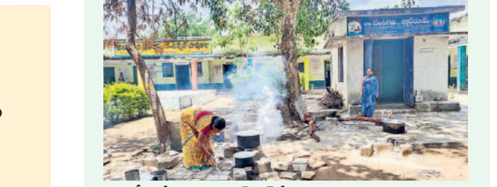
భీమవేదవరపు : కిన్సెన్ షెడల్ ఆరు బయట కట్టల పొయ్యి వంట చేస్తున్న మధ్యాహ్న భోజన నిర్వాహకులు

గిర్నాజీపేట: తమకు రావాల్సిన బకాయిలు సకాలంలో చెల్లించకపోవడంతో మధ్యాహ్న భోజన పథకం కార్యకులు తీవ్ర ఇబ్బందులు పడుతున్నారు. నెల తరబడి నిధులు కేటాయింపకపోవడంతో అధికంగా భార మవుతున్నదని ఆవేదన వ్యక్తం చేస్తున్నారు. ప్రస్తుతం పాఠశాల విద్యార్థులకు ఒకటి నుంచి ఐదో తరగతి వరకు రూ. 5.45, ఆరు నుంచి ఎనిమిది వరకు రూ. 8.17, తొమ్మిది, పదో తరగతి విద్యార్థులకు రోజుకు ఒక్కొక్కటి రూ. 10.87 చొప్పున ప్రభుత్వం చెల్లిస్తోంది. మధ్యాహ్న భోజన నిర్వాహకులకు గౌరవ వేతనం రూ. 10 వేలకు పెంచుతామని ఎన్నికల సమయంలో కాంగ్రెస్ హామీ ఇచ్చింది. పెంచిన వేతనం మాట అటంబి, గతంలో కేసీఆర్ ప్రభుత్వం ఇచ్చిన రూ.3వేలు కూడా అందించడం లేదని ఏజెన్సీ మహిళలు ఆవేదన వ్యక్తం చేస్తున్నారు. అలాగే, సర్కూజ్ అభియాన్, ఇంక్లాజివ్ ఎడ్యుకేషన్ రిసోర్స్ పర్సన్ (ఇకాఆర్ఎస్)లకు మేవరకే జీతాలు అందాయి. గతంలో పాఠశాలలో పాఠకులకు పనులను జీపీ సిబ్బంది చూడగా, ప్రస్తుతం ఆ బాధ్యతను అమ్మ ఆదర్శ కమిటీలకు అప్పగించడంతో నిర్వహణ ప్రశ్నార్థకంగా మారింది. పేద విద్యార్థుల ఆకలి తీర్చే సీఎం బ్రేక్ ఫాస్ట్ కార్యక్రమం ఆగిపోయింది.