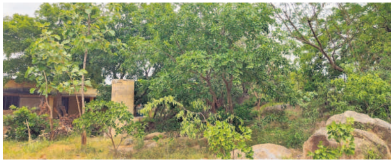
చెట్ల పాదల్లో పాదపల్లి జడ్చీ, ఉన్నత పాఠశాల