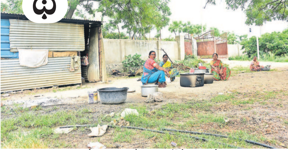
యాదాద్రిగిరి జడ్చీ, ఉన్నత పాఠశాలలో అవలభ్య ప్రదేశాల్లో మధ్యాహ్న భోజన పంటకాలు