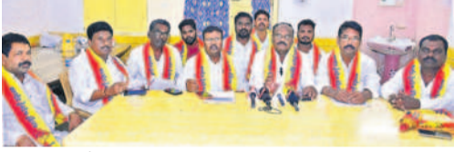
సమావేశంలో మాట్లాడుతున్న మున్సిపల్ మాజీ చైర్మన్ ఆంజనేయులు