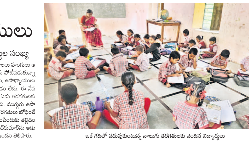
ఒక గదిలో చదువుకుంటున్న నాలుగు తరగతులకు చెందిన విద్యార్థులు

ఏడు తరగతులు.. ఇద్దరు ఉపాధ్యాయులు ప్రభుత్వ నిర్లక్ష్యంతో తగ్గుతున్న విద్యార్థుల సంఖ్య మిడ్డే, జూలై 10 : ప్రస్తుత పోటీ ప్రవచనంలో ప్రైవేట్ పాఠశాలలు హంగులు ఆర్థికాలతో విద్యార్థులను తమ పాఠశాలలో చేర్చుకునేందుకు పోటీపడుతున్నాయి. ఈ నేపథ్యంలో ప్రభుత్వ పాఠశాలలో స్వల్ప సంఖ్యలోనే విద్యార్థులు లేక చాలా మంది సర్కారు బడికి వెళ్లేందుకు సుముఖత చూపడం లేదు. ఈ నేపథ్యంలో మండలంలోని ఖైరంపల్లి ప్రాథమిక స్కూళ్ల పాఠశాలలో ఏడు తరగతులకు 60 మంది విద్యార్థులు ఉండగా, ఇద్దరు ఉపాధ్యాయులు ఉన్నారు. ముగ్గురు ఉపాధ్యాయులు బదిలీపై వెళ్లారు. దీంతో ఒకే తరగతి గదిలో 2,3,4 తరగతులు బోధించే పరిస్థితి నెలకొన్నది. ఉపాధ్యాయులు లేకపోవడంతో బడికి పంపేందుకు తల్లిదండ్రులు సుముఖత చూపడం లేదు. ఈ విషయంపై ఛాన్సలర్ మినోమ్మలకు అడుగూ, బదిలీపై ముగ్గురు ఉపాధ్యాయులు పాఠశాలకు రావాలి ఉందని తెలిపారు.