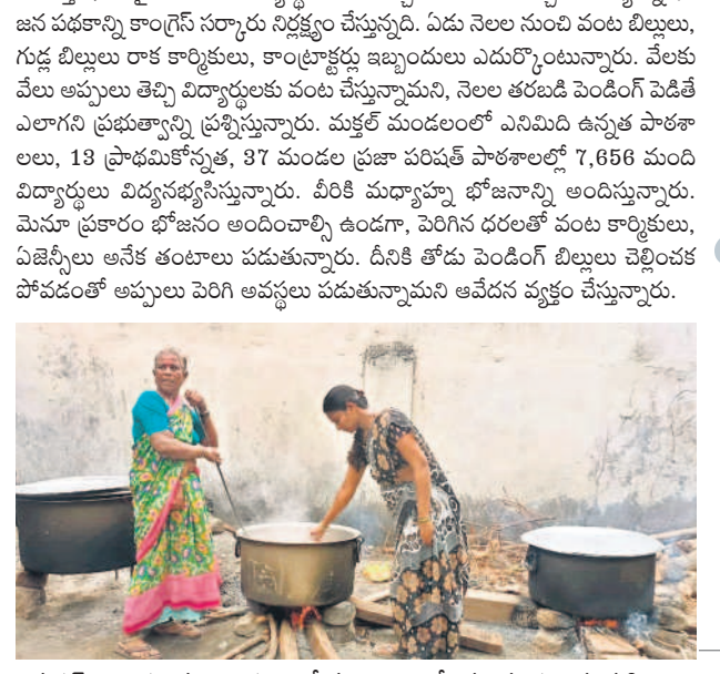
మక్తల్ బాలుర ఉన్నత పాఠశాలలో మధ్యాహ్నం భోజనం వండుతున్న మహిళలు

వంట ఏజెన్సీల ఆవేదన ఏడు నెలల బియ్యం రాక ఇబ్బందులు మక్తల్, జూలై 10 : పేద విద్యార్థుల ఆకలి తీర్చేందుకు తీసుకొచ్చిన మధ్యాహ్నం భోజన పథకాన్ని కాంగ్రెస్ సర్కారు నిర్లక్ష్యం చేస్తున్నది. ఏడు నెలల నుంచి వంట బియ్యం, గుడ్ల బియ్యం రాక కార్మికులు, కాంగ్రెస్ పార్టీ ఇబ్బందులు ఎదురౌతున్నాయి. వేలకు వేలు అప్పులు తెచ్చి విద్యార్థులకు వంట చేస్తున్నామని, నెలల తరబడి పెండింగ్ పడితే ఎలాగని ప్రభుత్వాన్ని ప్రశ్నిస్తున్నారు. మక్తల్ మండలంలో ఎనిమిది ఉన్నత పాఠశాలలు, 18 ప్రాథమిక స్కూళ్ల, 37 మండల ప్రజా పబ్లిక్ పాఠశాలలో 7,856 మంది విద్యార్థులు విద్యనభ్యసిస్తున్నారు. వీరికి మధ్యాహ్నం భోజనాన్ని అందిస్తున్నారు. మేనూ ప్రకారం భోజనం అందించాల్సి ఉండగా, పెరిగిన ధరలతో వంట కార్మికులు, ఏజెన్సీలు అనేక తంటాలు పడుతున్నారు. దీనికి తోడు పెండింగ్ బియ్యం చెల్లించకపోవడంతో అప్పులు పెరిగి అవస్థలు పడుతున్నామని ఆవేదన వ్యక్తం చేస్తున్నారు.