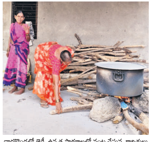
చారకొండలో జెడ్పీ ఉన్నత పాఠశాలలో వంట చేస్తున్న కార్మికులు