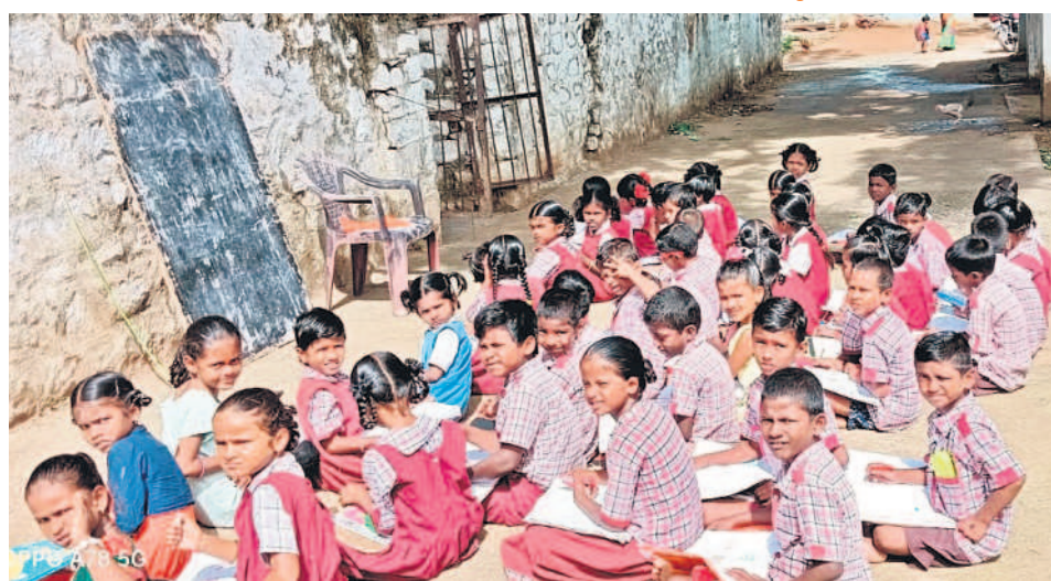
దామరగడ్డ జీపీఎస్ పాఠశాల భవనం ఎదుట ఆరుబయట కూర్చున్న విద్యార్థులు

వంట చేస్తున్న సిబ్బంది ఐదు నెలల బియ్యం పెండింగ్లోనే.. అప్పులు తెచ్చి మధ్యాహ్నం భోజనం వండుతున్నాం : కాంగ్రెస్ పార్టీ ఆవేదన గద్దాల టౌన్, జూలై 10 : ఐదు నెలలుగా మధ్యాహ్నం భోజనం బియ్యం చెల్లించుకోని నిర్లక్ష్యం.. గుడ్ల బియ్యం చెల్లించుకోవడం లేదు.. నాణ్యత లోపించిన బియ్యం పంపిణీ.. ఇలా ఇప్పటి వరకు మధ్యాహ్నం భోజనం పక్కం కట్టవేసిన విద్యార్థుల తల్లిదండ్రులు ఆసు మానం వ్యక్తం చేస్తున్నారు. సకాలంలో బియ్యం చెల్లించకపోవడంతో ఇబ్బందులకు గురవుతున్నామని కాంగ్రెస్ పార్టీ వాపోతున్నారు. వడ్డీకి తెచ్చుకునే పరిస్థితి ఏర్పడిందని ఆవేదన వ్యక్తం చేస్తున్నారు. పదేండ్ల కేసీఆర్ సర్కారులో ఎప్పుడూ బియ్యం పెండింగ్లో పెట్టలేదని, ఇప్పటికైనా కాంగ్రెస్ ప్రభుత్వం బియ్యం చెల్లించాలని కాంగ్రెస్ పార్టీ కోరుతున్నారు.