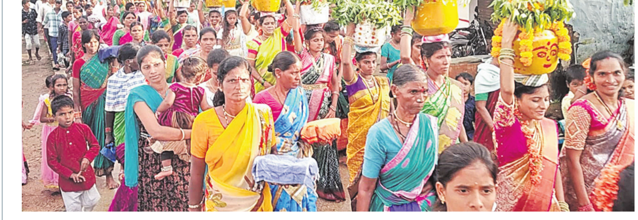
ధారూరు మండలంలోని నాగనమండల్ గ్రామంలో బోనాలతో ఊరేగింపుగా వెళ్తున్న మహిళలు