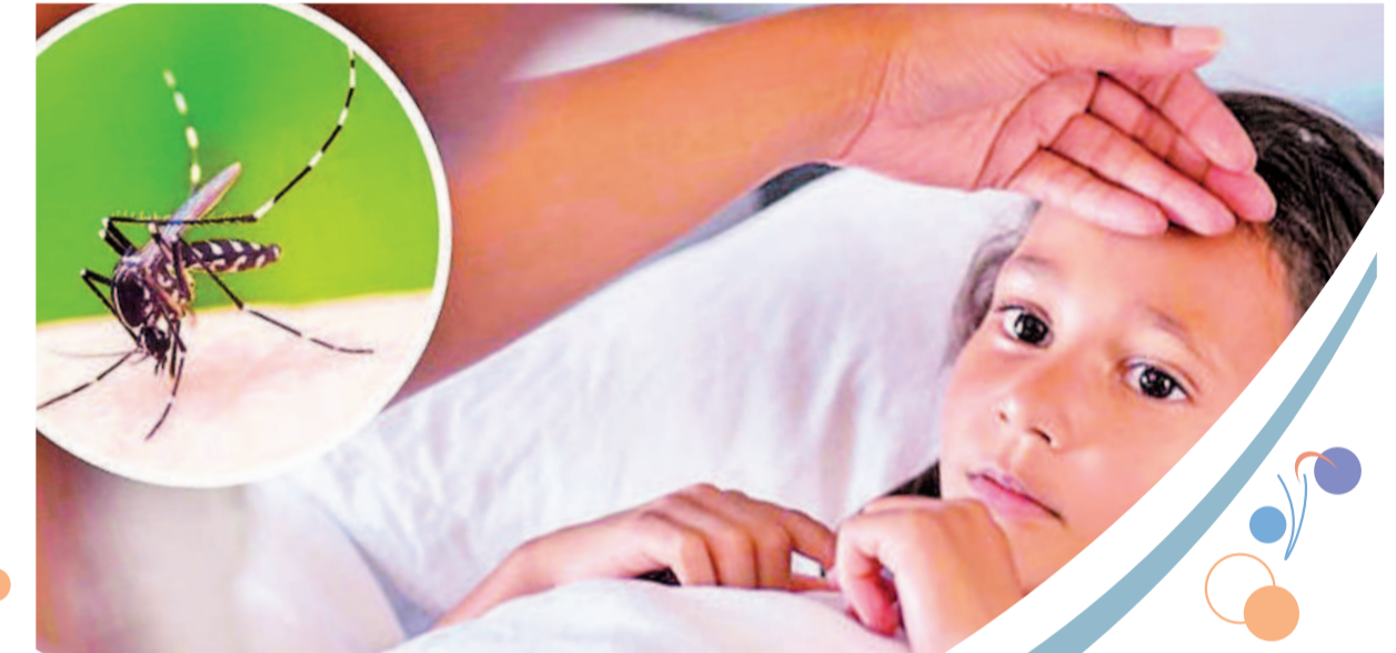
జిల్లాలో డెంగీ కేసులు పెరుగుతున్నాయి. పాగింజి వంటి చర్యలు మొక్కుబడిగానే ఉంటున్నట్లు విమర్శలు వస్తున్నాయి.

గ్రామీణ ప్రాంతాల్లోనూ డెంగీ కేసులు.. నిన్న మొన్నటి వరకు సగరాలు, మున్సిపాలిటీలలోనే కనిపించిన డెంగీ కేసులు గ్రామీణ ప్రాంతాల్లోనూ నమోదవుతున్నాయి. జిల్లాలో పీహెచ్ఎస్, యూపీహెచ్ఎస్లు 42 వరకు ఉండగా.. జిహెచ్ఎస్ పరిధిలో 89 డెంగీ కేసులు, మున్సిపాలిటీల పరిధిలో 21 కేసులు, గ్రామీణ ప్రాంతాల్లో నాలుగు కేసులు నమోదయ్యాయి. రెండవోంజిల క్రితం చేపెళ్ల మండలానికి చెందిన 11 ఏండ్ల బాలుడు డెంగీ బారినపడి మరణించడం ఆందోళన కలిగిస్తున్నది. ప్రస్తుతం వర్షాలు కురుస్తుండడంతో పల్లెలు, పట్టణాలు చిత్తడిచిత్తడిగా మారాయి. ప్రభుత్వం నుంచి నిధులు విడుదల చేయకపోవడంతో పారిశుధ్య నిర్వహణ సైతం అస్పష్టంగా మారింది. పరిసరరాల్లో నిల్వ ఉన్న నీటితో డెంగీ సంబంధిత డోసులు వృద్ధి చెందుతున్నాయి. సీజనల్ వ్యాధులు సైతం విజృంభిస్తున్నాయి. డింతో చాలామంది జ్వరం, దగ్గు, జలుబు వంటి సమస్యలతో బాధపడుతున్నారు. ఈ క్రమంలో ప్రభుత్వ, ప్రైవేటు ఆసుపత్రులలో ఓపీకీ తాకిడి పెరిగింది. జిల్లాలో ఈ ఏడాది జనవరి నుంచి ఇప్పటివరకు ప్రభుత్వ ఆసుపత్రులలో సుమారు 8వేలకు పైగా విజృంభణ కేసులు నమోదైనట్లు తెలుస్తున్నది. సీజనల్ వ్యాధులపై ప్రజలను చైతన్యపర్చడం, పాగింజి వంటి చర్యలు మొక్కుబడిగానే ఉంటున్నట్లు విమర్శలు వస్తున్నాయి.