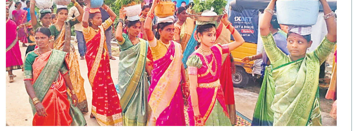
కుకడవద్ద మండలంలోని మరలకల్ గ్రామంలో బోనాలతో ఊరేగింపుగా వెళ్తున్న మహిళలు

చెల్లించుకున్నారు. ఈ ఏడాది చంటలు బాగా పండి సుఖంతోపాటుతో ఉండేలా ఆశీర్వదించు అమ్మవార్ల తల్లి అంటూ ఆలయాల చుట్టూ ప్రదక్షిణలు చేసి వేడుకున్నారు.