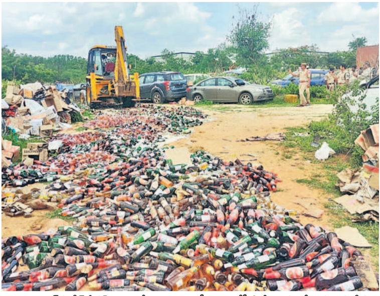
మొయినాబాద్ పోలీస్ స్టేషన్ ఆవరణలో అక్రమ మద్యం సీసాలను జేసీబీతో ధ్వంసం చేయిస్తున్న పోలీసులు