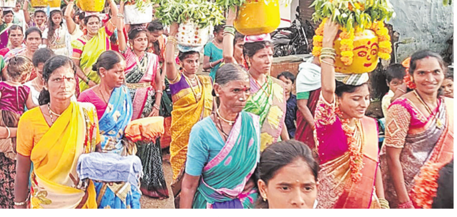
శివసత్తుల పూసకాలు, పోతరాజుల విన్యాసాలు, చిన్నాపెద్ద కేరింతలు, ఆటపాటలతో పల్లెల్లో సందడి నెలకొన్నది. భక్తులు ఆలయాలకు చేరుకుని అమ్మవార్లకు ప్రత్యేక పూజలు చేసి నైవేద్యం సమర్పించి మొక్కులు