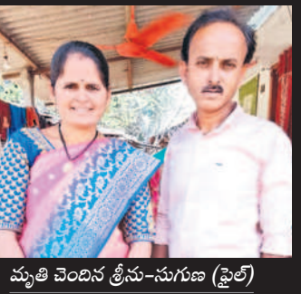
ప్రేమించిన త్రిను-సుగణ (పైకి)