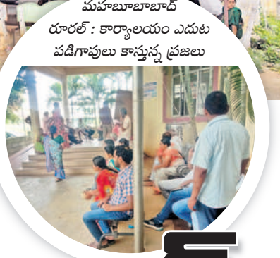
మహబూబాబాద్ రూరల్ : కార్యాలయం ఎదుట పడిగాపులు కాస్తున్న ప్రజలు