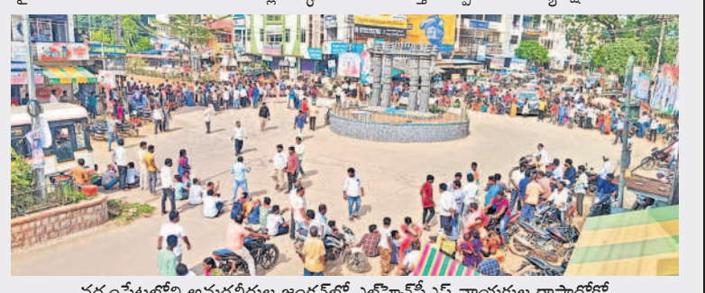
నర్సంపేటలోని అమరవీరుల జంక్షన్లో ఎల్.హెచ్.ఎస్.నాయకుల రాస్టాలోకో