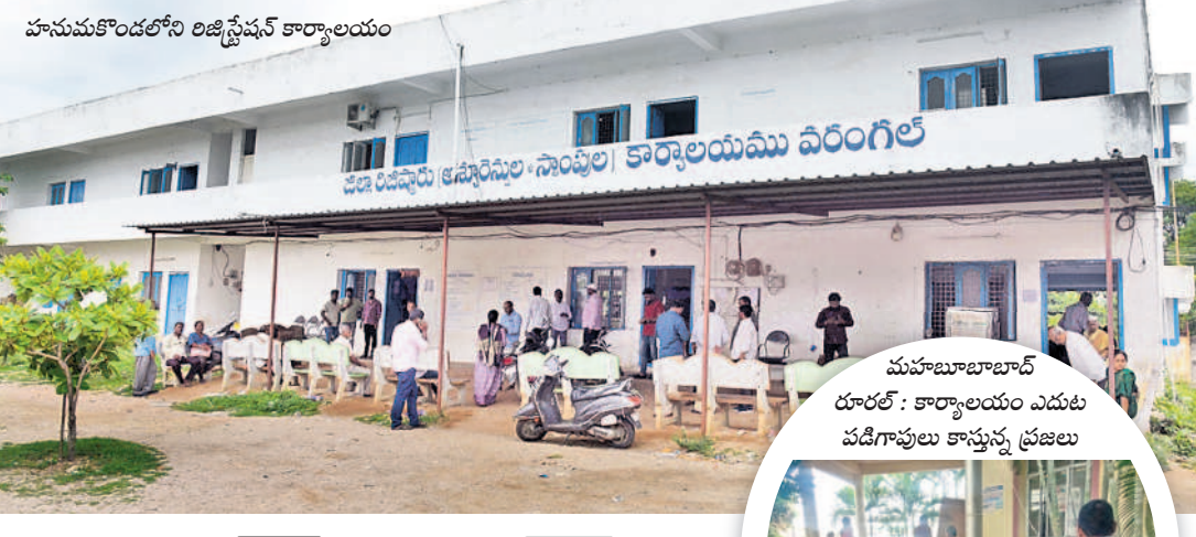
హనుమకొండలోని రిజిస్ట్రేషన్ కార్యాలయం