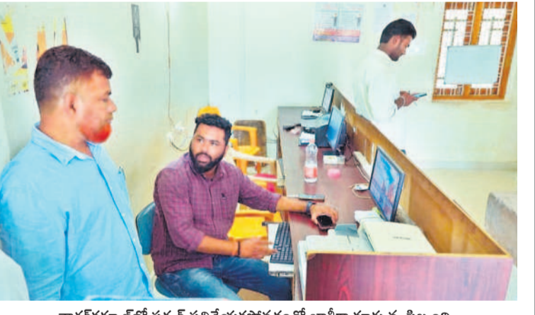
నాగర్ కర్నూల్ లో సర్కర్ పనిచేయకపోవడంతో ఖాళీగా కూర్చున్న సిబ్బంది

ఎల్ ఆర్ ఎస్ కోసం పాలమూరులోని ఐదు జిల్లాల్లో 64వేల మంది దరఖాస్తు చేసుకొన్నారు. దీనిపై ఇప్పటికే స్పష్టత రాలేదు. ఇలా రిజిస్ట్రేషన్ ప్రక్రియ ముందుకూ, వెనకకూ అన్నట్లు సాగుతుండగా సాంకేతిక సమస్య ఆ కాఖకు ముంతం వచ్చడం సేవలు అందుతాయనే సమాచారం వచ్చడం తెలియజేసింది. ఇదిలా ఉంటే సాంకేతిక సమస్యతో తిరిగి వెళ్లిన వారికి కచ్చితంగా శుక్రవారం సేవలు అందుతాయనే సమాచారం వచ్చడం తెలిపారు. ఫోన్ చేసి కనుక్కొని రావాలనే ఆసక్తికరమైన సమాచారం మాత్రం అభించడంతో నిట్టూర్పుకుంటూ తిరిగి వెళ్లారు.