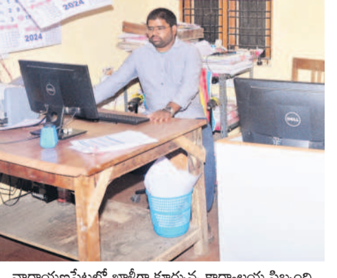
నారాయణపేటలో ఖాళీగా కూర్చున్న కార్యాలయ సిబ్బంది

నారాయణపేట, జూలై 11 : నారాయణపేట సబ్ రిజిస్ట్రార్ కార్యాలయంలో గురువారం రిజిస్ట్రేషన్లు అగ్రపోవడంతో జనం ఇక్కడ పాలయ్యారు. సర్కర్ డౌన్ కావడం వల్ల ఈ సమస్య తలెత్తిస్తున్న కార్యాలయం సిబ్బంది చెబుతున్నారు. సబ్ రిజిస్ట్రార్ కార్యాలయాల వద్ద రిజిస్ట్రేషన్లు జరుగకపోవడంతో రిజిస్ట్రేషన్, ఈ.సి. సీసీ ప్రజలు కోసం వచ్చిన వినియోగదారులు తీవ్ర ఆవేషం వచ్చారు. రోజూ వారి మాదిరిగానే కార్యాలయంలో సేవలు అందుతాయని రిజిస్ట్రేషన్ కోసం గురువారం సైతం కార్యాలయానికి వచ్చిన జనం గంటల తరబడి కార్యాలయం వద్ద వేచి చూశారు. కాకేవెసి, సర్కర్ పనిచేయకపోవడంతో రిజిస్ట్రేషన్ ప్రక్రియ నిలిచిపోయింది కార్యాలయం సిబ్బంది అభిప్రాయపడ్డారు. చేసేది ఏమిటో విచారించి పెండింగ్ అఫైర్స్ పనులను చేసుకుంటూ దర్బారుమీచారు.