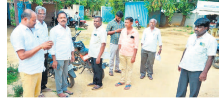
నాగర్ కర్నూల్ సబ్ రిజిస్ట్రార్ కార్యాలయం వద్ద పడిగావులు కాస్తున్న ప్రజలు

నాగర్ కర్నూల్, జూలై 11 (నమస్తే తెలంగాణ) : సర్కర్ నిలిచిపోవడంతో రిజిస్ట్రేషన్ కార్యాలయాల్లో కార్యకలాపాలు స్తంభిల్చాయి. ప్రభుత్వానికి ప్రధాన ఆదాయ వనరుల్లో ఒకటిైన వ్యవసాయేతర భూముల రిజిస్ట్రేషన్లకు సాంకేతిక సమస్య ఎదురైంది. దీంతో రాష్ట్రవ్యాప్తంగా సబ్ రిజిస్ట్రార్ కార్యాలయాల్లో సేవలకు గురువారం అంతరాయం ఏర్పడింది. వ్యవసాయ భూముల రిజిస్ట్రేషన్ ప్రక్రియకు తీవ్ర ప్రభుత్వం ధరణి వేధకం తీసుకొచ్చింది. ఇందులో భాగంగా రిజిస్ట్రార్ కార్యాలయాల్లో వ్యవసాయేతర భూముల నమోదు కోసం ముందస్తుగా స్లాట్లను బుక్ చేసుకున్న పలువురు గురువారం కార్యాలయాలకు చేరుకోగా సర్కర్ డౌన్ కావడంతో రిజిస్ట్రేషన్ నిలిచిపోయాయి. ఒక్కో సబ్ రిజిస్ట్రార్ కార్యాలయంలో సాధారణంగా 20 నుంచి 30 వరకు రిజిస్ట్రేషన్లు జరుగుతాయి. అయితే ఈ కేవెసి సమస్య తలెత్తడంతో రిజిస్ట్రేషన్ నిలిచిపోగా కార్యాలయాలకు వచ్చిన పలువురు సాయంత్రం వరకు అక్కడే పడిగావులు కాస్తూ కనిపించారు. ఫ్యాబ్రిక్, ఇండ్ల అమ్మకాలు, కొనుగోలుదారులతోపాటు సాక్షులు కూడా కార్యాలయాలకు రావాల్సి ఉంటుంది. దీనివల్ల చాలా మంది కార్యాలయాలకు వచ్చి మధ్యాహ్నం వరకు రుంజుకుంటున్నారని తెలిపారు.