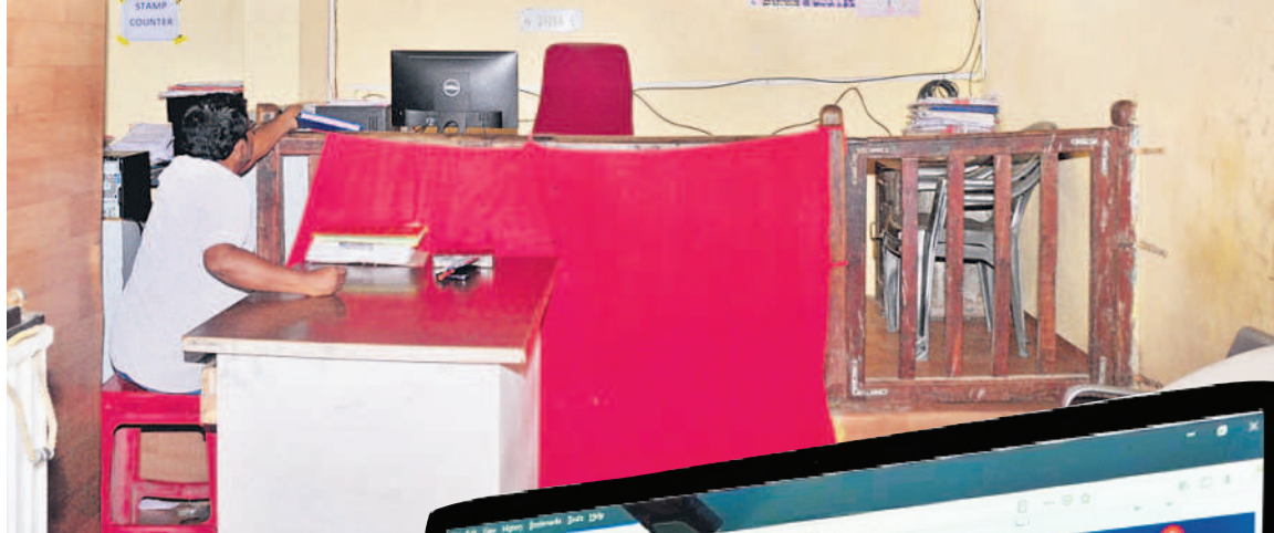
సర్కర్ పనిచేయకపోవడంతో బోసీపోయిన నారాయణపేట సబ్ రిజిస్ట్రార్ కార్యాలయం