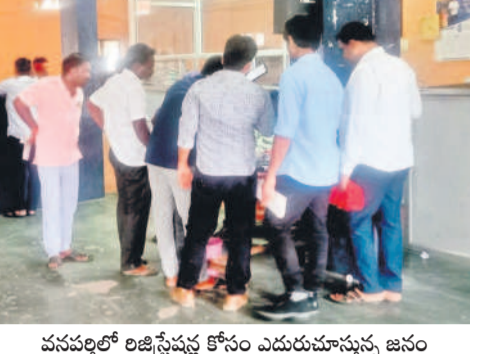
వనపర్తిలో రిజిస్ట్రేషన్ కోసం ఎదురుచూస్తున్న జనం

జడ్చర్లలో, జూలై 11 : జడ్చర్ల సబ్ రిజిస్ట్రేషన్ కార్యాలయంలో ఆన్ లైన్ సాంకేతిక సమస్యతో ఫైల్ లు సంబంధించిన రిజిస్ట్రేషన్లు నిలిచిపోయాయి. గురువారం ఉదయం 10 గంటలకు ప్రారంభమైన కార్యాలయంలో ఐదు గంటల వరకు సర్కర్ పనిచేయకపోవడంతో రిజిస్ట్రేషన్లు నిలిచిపోయాయి. సర్కర్ పనిచేయక కార్యాలయం సిబ్బంది బోర్టింగ్ కార్యక్రమాన్ని ప్రారంభించి. ఆదేశాలను సుమారు ప్రాంతాల నుంచి రిజిస్ట్రేషన్ కోసం వచ్చిన వారందరూ వెనుదిరిగిపోయారు. ఆన్ లైన్ రిజిస్ట్రేషన్లకు సర్కర్ అప్పుడూ పనిచేసేస్తోందో, ఎప్పుడో పనిచేయడం తెలియని పరిస్థితి ఏర్పడింది. నిత్యం ఈ సమస్య ఎదురవుతుండడంతో రిజిస్ట్రేషన్లకు ఇబ్బందిగా ఉండని పలువురు ఆసక్తికరమైన వ్యక్తులు, ఈ విషయంపై కార్యాలయం సిబ్బంది వివరణ కోరగా రాష్ట్ర వ్యాప్తంగా సర్కర్ సమస్యతో రిజిస్ట్రేషన్లు జరగలేదని చెప్పుకొచ్చారు.