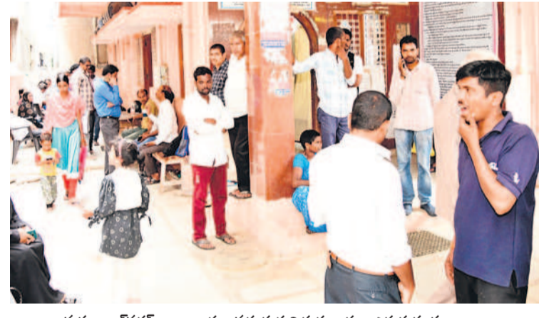
మహబూబ్ నగర్ కార్యాలయం వద్ద క్రయవిక్రయదారుల ఎదురుచూపులు

లయపు సాయంత్రం వరకు అక్కడే పడిగావులు కాస్తూ కనిపించారు. ఫ్యాబ్రిక్, ఇండ్ల అమ్మకాలు, కొనుగోలుదారులతోపాటు సాక్షులు కూడా కార్యాలయాలకు రావాల్సి ఉంటుంది. దీనివల్ల చాలా మంది కార్యాలయాలకు వచ్చి మధ్యాహ్నం వరకు రుంజుకుంటున్నారని తెలిపారు.