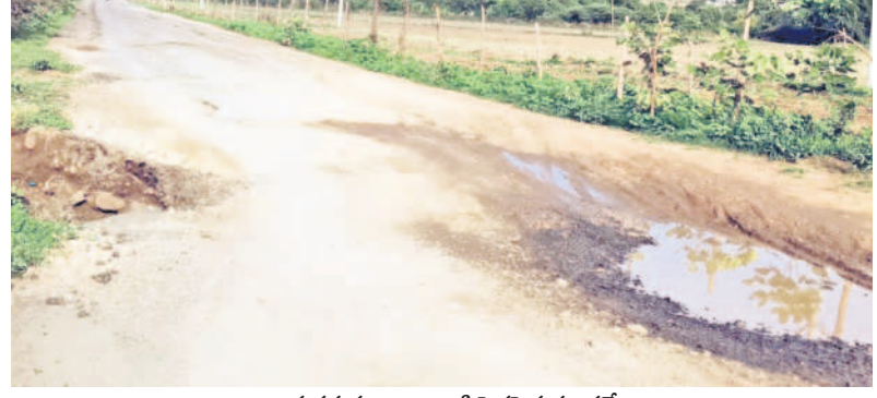
అడుగుడుగునా ఇలాంటి పెద్దపెద్ద గుంతలే

నార్సూర్, జూలై 11 : ఆ మార్గంలో వెళ్లేటం సహా సోపేతమే. పెద్దపెద్ద గోతులు ప్రమాదాలను పిలిచిన టూగా ఉంటాయి. వేగంలో నియంత్రణ కొరవడితే వాహనం బోల్చా కొట్టాల్సిందే. ఇక భారీ వాహనాలైతే ఆ మార్గంలో వెళ్లేటప్పుడు ఇందులో ఉన్న వారు ఉయ్యాలగుతున్న అనుభూతి. ఈ రహదారిపై నిత్యం ప్రమాదాలు జరుగుతూనే ఉన్నాయి. అయినా సంబంధిత అధికారులు, ప్రజాప్రతినిధులకు మరమ్మత్తు చేయించాలని ఆలోచన రాకపోవడం గమనార్హం. తాడిహత్తూర్ నుంచి గాడిగూడ గ్రామ సమీపం 30 మీటర్ల వరకు అడ్డాపాడు వారింది. వర్షం కలిసినప్పుడు వరద రోడ్డు మీదకు వేరడం, ఆ మార్గంలో వాహనాల రద్దీ అధికంగా ఉండడం వంటి కారణాలతో అధ్యానంగా ఉన్న రహదారిపై పెద్దపెద్ద గోతులు ఏర్పడ్డాయి. ఆయా గుంతలు కేవలం 30కిలో మీటర్ల దూరం అంతా ప్రమాదం ఉన్నప్పటికీ పూర్తిగా మరమ్మత్తు సంబంధిత శాఖ అధికారులు కనీస ప్రయత్నం చేయకపోవడం విచారకరం. కేసీఆర్ ప్రభుత్వం హాస్పిటల్స్ చౌరస్తా వద్ద నుంచి ఎల్లప్పుడూ వరకు డబుల్ రోడ్డు నిర్మాణానికి రూ.4కోట్లు మంజూరు చేసింది. హాస్పిటల్స్ నుంచి తాడిహత్తూర్, రాజాగోడ నుంచి నార్సూర్ వరకు డబుల్