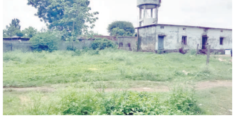
గిరిజన ఆశ్రమ పాఠశాల ఆవరణలో పెరిగిన పిచ్చిగడ్డి

ఇంద్రవెల్లి, జూలై 11: మండలంలోని పిచ్చిగడ్డి గ్రామంలోని గిరిజన ఆశ్రమ పాఠశాలలో పెరిగిన పిచ్చిగడ్డితో విద్యార్థులు ఇబ్బంది పడుతున్నారు. భోజన శాలలోని పరిసర ప్రాంతాల్లో చేరిచంపుతో పాటు గోడ, సిబ్బంది ఉండే గదుల చుట్టు ప్రాంతంలో పాఠశుద్ధ్యం లోపించి పిచ్చిగడ్డి పెరిగిపోయింది. ఇప్పటికైన ఐటీడీపీ శాఖతో పాటు గిరిజన ఆశ్రమ పాఠశాలకు చెందిన సిబ్బంది నిత్యం పాఠశుద్ధ్య పనులు నిర్వహించి పరిశుభ్రతను పాటించాలని గ్రామాల ప్రజలు కోరుతున్నారు