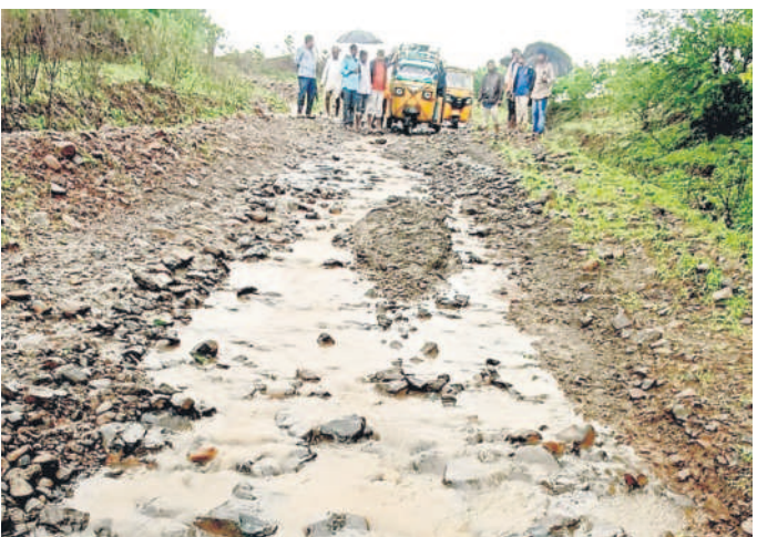
అధ్యానంగా తయారైన మహాదాపూర్ మట్టిరోడ్డు

నార్సూర్, జూలై 11 : నార్సూర్ మండల ఖంపూర్ గ్రామ పంచాయతీ పరిధిలోని మహాదాపూర్ గ్రామానికి వెళ్లే మట్టి రోడ్డు విస్తృతంగా మారింది. రాళ్లు తేలి గుంతలయయంగా మారింది. గుంతల్లో వర్షపు నీరు నిండి ఉండడంతో వాహనదారులు, పాదాచారులు ఇబ్బందులు పడుతున్నారు. అత్యధిక సమయంలో గ్రామానికి అబిలెన్స్ వెళ్లాలంటే వర్ష తీతం. చిత్తగూడ నుంచి మహాదాపూర్ వరకు కేసీఆర్ ప్రభుత్వం బీటీ రోడ్డు మంజూరు చేసినప్పటికీ సంబంధిత శాఖ అధికారుల నిర్లక్ష్యంతో పనులు నేటికీ ప్రారంభించలేదు. బీటీ రోడ్డు పనులు చేపట్టాలని అధికారుల దృష్టికి తీసుకెళ్లిన తమ గోడను పట్టింప కోవడం లేదని గ్రామస్థులు వాపోతున్నారు. వాహనదారులు జారి పడిన సంఘటనలు చెప్పలేనివి. ఇప్పటికైనా జిల్లా కలెక్టర్, సంబంధిత శాఖ అధికారులు స్పందించి తమ రోడ్డుకు మరమ్మత్తులు చేపట్టాలని గ్రామ ప్రజలు కోరుతున్నారు.