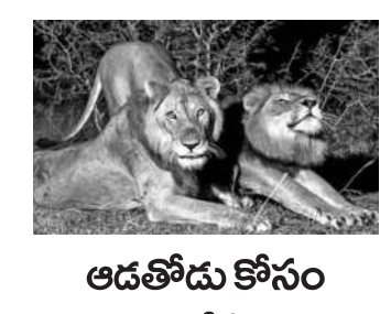
అడతొడు కోసం 1.3 కిలోమీటర్లు ఈదిన మగసింహాలు

సూపర్డ్ క్యాట్కాల్ పై స్విట్జర్లాండ్ నిషేధం... బెర్న్, జూలై 11: క్షణాల్లో ప్రాణాలు తీసేసే సూపర్డ్ క్యాట్కాల్ పై స్విట్జర్లాండ్ నిషేధం విధించింది. స్విట్జర్లాండ్ నిషేధం విధించింది. స్విట్జర్లాండ్ నిషేధం విధించింది.