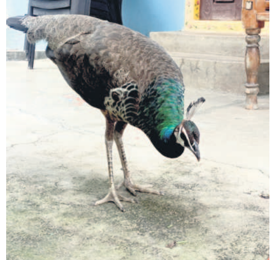
జాతీయ పక్షి నెమలి

నిర్మల్ అర్బన్, జూలై 11 : అటవీ ప్రాంతాలు, డబ్బలను ప్రదేశాల్లో, పార్కుల్లో అరుదుగా కనబడే జాతీయ పక్షి నెమలి జనార్లొకి పక్షిగా నిర్ణయించారు. జనార్లొకి పక్షిని నెమలిగా నిర్ణయించారు. డిఎస్ఆర్ జనార్లొకి పక్షిగా నిర్ణయించారు. డిఎస్ఆర్ జనార్లొకి పక్షిగా నిర్ణయించారు. డిఎస్ఆర్ జనార్లొకి పక్షిగా నిర్ణయించారు.