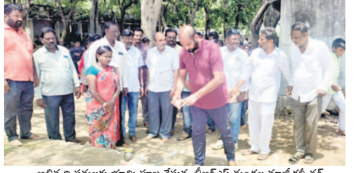
అభివృద్ధి పనులకు భూమి పూజ చేస్తున్న టీఆర్ఎస్ మండల మాజీ కన్వీనర్

తాంసి, జూలై 11: పాఠశాల అభివృద్ధి, సంక్షేమమే ధ్యేయంగా ముందుకు సాగుతున్నామని టీఆర్ఎస్ మండల మాజీ కన్వీనర్, మాజీ సర్పంచి స్వయంగా కట్టి ప్రకారం అన్నారు. గురువారం మండలకేంద్రంలోని జిల్లా పరిషత్ ఉన్నత పాఠశాలలో రూ.10 లక్షలతో చేపడుతున్న డ్రైనింగ్ చానల్, రూ.8 లక్షలతో