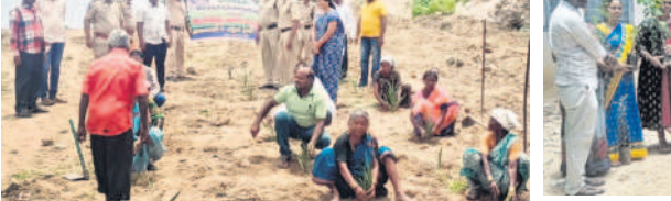
కోనాసముందర్లో మహిళాసంఘాల సభ్యులకు మొక్కలు పంపిణీ చేస్తున్న ఎంపీవో