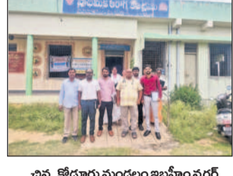
ప్రాథమిక ఆరోగ్య కేంద్రాల సందర్శన గత ప్రభుత్వ కార్యక్రమాల సందర్భంగా