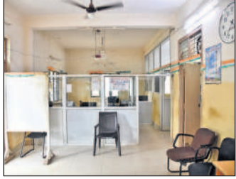
సర్వర్ డాన్ అవ్వడంతో బోసిపోయిన సిద్దిపేట సబ్ రిజిస్ట్రార్ కార్యాలయం

సిద్దిపేట, జూలై 11 : నిత్యం జనంతో కిక్కిరిసి ఉండే సిద్దిపేట సబ్ రిజిస్ట్రార్ కార్యాలయం గురువారం బోసిపోయింది. రాష్ట్ర వ్యాప్తంగా రిజిస్ట్రేషన్ శాఖ సర్వర్ డాన్ కావడంతో, ఈ కేసుల రాకపోవడంతో సిద్దిపేటలోనూ రిజిస్ట్రేషన్ సేవలు నిలిచిపోయాయి. సిద్దిపేట అర్బన్ సబ్ రిజిస్ట్రార్ కార్యాలయంలో 20 డాక్యుమెంట్లు రాగా ఉదయం తొలి గంటలో మూడు డాక్యుమెంట్లు మాత్రమే రిజిస్ట్రేషన్ అయ్యాయి. సిద్దిపేట రూరల్ సబ్ రిజిస్ట్రార్ కార్యాలయంలో 8 డాక్యుమెంట్లు రాగా సర్వర్ డాన్ కావడంతో ఒక్క డాక్యుమెంట్ రిజిస్ట్రేషన్ కావడం, రిజిస్ట్రేషన్ కోసం వచ్చిన వినియోగదారుల సైతం వేచి