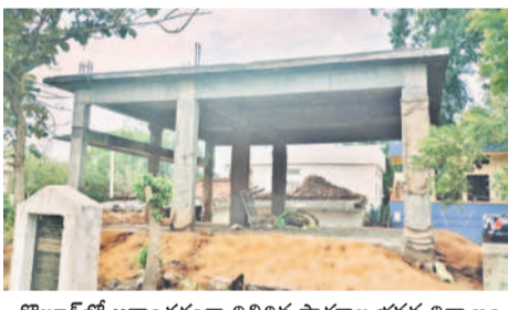
కొల్లూర్లో అర్ధాంతరంగా నిలిచిన పాఠశాల భవన నిర్మాణం

ఉమ్మడి మండలంలోని కొల్లూర్ గ్రామంలో అర్ధాంతరంగా పాఠశాల భవన నిర్మాణం నిలిచిపోయింది. కొల్లూర్ ప్రభుత్వ ప్రాథమిక పాఠశాలలో ఒకటి నుంచి ఐదో తరగతులు ఉండగా, అందులో 14 మంది విద్యార్థులు, ఉపాధ్యాయుని ఉన్నారు. కొల్లూర్లోని ప్రభుత్వ పాఠశాల భవనం నిర్మాణానికి రూ.10 లక్షలు మంజూరుకాగా గుత్తేదారుకు బిల్లులు రాకపోవడంతో పనులు నిలిపివేశారు. గతేడాది స్థానిక అంగన్వాడీ కేంద్రంలో తరగతులు నిర్వహించి అనంతరం స్థానిక గ్రామ పంచాయతీ భవనంలో ఇరుకైన గదిలోనే కొనసాగుస్తున్నారు.