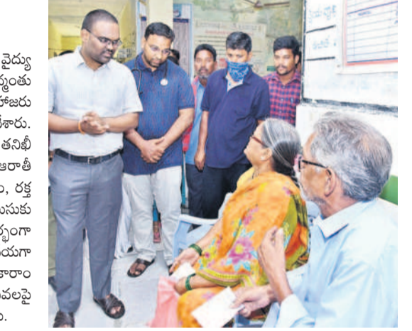
వర్షి కమ్యూనిటీ హెల్త్ సెంటర్లో అందుతున్న వైద్య సేవపై రోగులను అడిగి తెలుసుకుంటున్న కలెక్టర్ రాజీవ్ గాంధీ హస్తాంతరం

బోడన్, జూలై 12: ప్రభుత్వ దవాఖానల్లో విడుదలకు హాజరుకాని వైద్యులపై విచారణ చేపట్టి చర్యలు తీసుకోవాలని కలెక్టర్ రాజీవ్ గాంధీ హస్తాంతరం అదేశించారు. జిల్లాలోని అన్ని ప్రభుత్వ దవాఖానల్లో బయోమెట్రిక్ హాజరు విధానాన్ని అమలుచేయాలని జిల్లా వైద్యాధికారి ఆదేశాలు జారీ చేశారు. వర్షిలోని ప్రభుత్వ దవాఖానల్లో హెల్త్ సెంటర్ ను ఆరంభించి తనిఖీ చేశారు. ప్రతి శుక్రవారం నిర్వహించే ఆరోగ్యమేళాలో మడుమేళం, రక్త పరీక్షలు నిర్వహిస్తున్న తీరుపై వైద్య సిబ్బందిని వివరాలు అడిగి తెలుసుకున్నారు. వైద్య సిబ్బంది హాజరుపట్టికను పరిశీలించారు. ఈ సందర్భంగా దవాఖానకు వైద్యులు సక్రమంగా రావడంలేదని కొందరు ఫిర్యాదుచేయగా.. దీనిపై విచారణ జరిపి చర్యలు తీసుకోవాలని జిల్లా వైద్యాధికారి తుకారాం రాజ్ గిడును కలెక్టర్ ఆదేశించారు. ప్రభుత్వ దవాఖానల్లో వైద్య సేవపై రోగులు, ప్రజల నమ్మకం పెంచాలని వైద్య సిబ్బందికి సూచించారు.