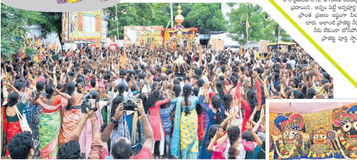
జిల్లాకేంద్రంలోని నీలకంఠేశ్వరాలయం వద్ద రథయాత్రలో పాల్గొన్న భక్తులు, రథంపై వేవతామూర్తులు (ఇన్సెల్లో)