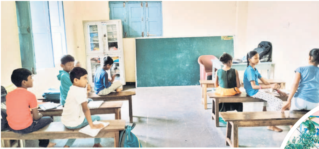
కొల్లూర్ గ్రామ పంచాయతీలో కొనసాగుతున్న పాఠశాల