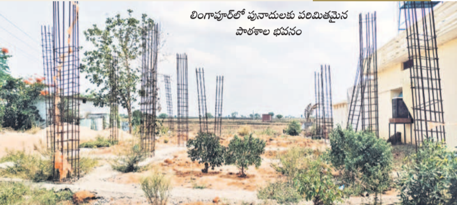
లింగాపూర్లో పునాదులకు పరిమితమైన పాఠశాల భవనం

కోటగిరి మండలం లింగాపూర్ గ్రామంలో పునాదులకే పరిమితమైంది పాఠశాల భవనం. లింగాపూర్ ప్రభుత్వ పాఠశాలలో ఒకటి నుంచి ఐదో తరగతి వరకు ఉండగా అందులో 16 మంది విద్యార్థులు, ఒక ఉపాధ్యాయుడు ఉన్నారు. పాఠశాల భవనం శిథిలావస్థకు చేరడంతో నూతన భవనం నిర్మాణానికి రూ.20 లక్షలు మంజూరయ్యాయి. పనులు మాత్రం పునాదులకే పరిమితమయ్యాయి. గత ఏడాది గ్రామ పంచాయతీలోనే చదువులు కొనసాగుతున్నాయి. ఈ బడికి అమ్మ ఆదర్శ పాఠశాలలో భాగంగా బాలికల మరుగు దొడ్ల నిర్మాణం, తాగునీటి సౌకర్యానికి రూ. 3 లక్షలు మంజూరయ్యాయి. భవనం లేకపోవడంతో ఆ పనులు సైతం నిలిచిపోయాయి.