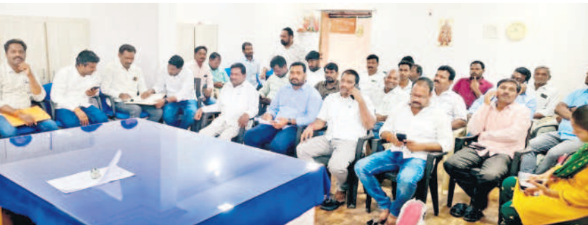
వనపర్తి విద్యుత్ డీఈ కార్యాలయంలో నిర్వహించిన సమావేశంలో పాల్గొన్న విద్యుత్ కాంట్రాక్టర్లు