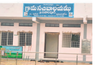
నిజామాపూర్ గ్రామ పంచాయతీ భవనం

ముగిసిన పదవీ కాలం.. గ్రామీణ ప్రాంతాల్లో ఉండి అన్ని స్థాయిల ప్రజాప్రతినిధుల పదవీ కాలం దాదాపు ముగిసింది. ఐదేండ్లుగా జెడ్పీటీసీలు, ఎంపీటీసీలు, ఎంపీటీసీలు పదవీ కాలం ముగిసారు. గత ఫిబ్రవరిలోనే సర్కంపల పదవీ కాలం ముగిసింది. జూలై 4తో జెడ్పీటీసీలు, జూలై 8తో ఎంపీటీసీలు గడువు సమాప్తమైంది. ప్రస్తుతం గ్రామ ప్రత్యేక అధికారులు పాలన కొనసాగుతున్నది. అలా పంచాయతీ నుంచి జిల్లా పరిషత్ వరకు ప్రత్యేకాధికారులు నియామకమయ్యారు.