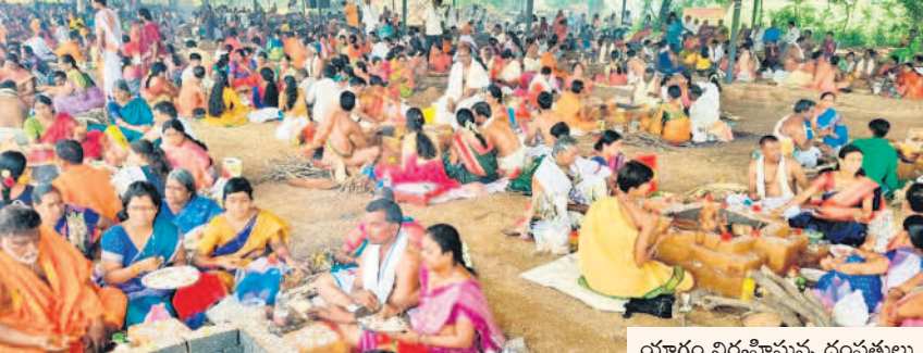
యాగం నిర్వహిస్తున్న దంపతులు