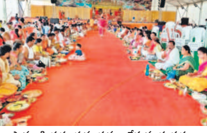
సామూహిక కుంకుమార్చనం చేస్తున్న దంపతులు

భయభీతులు పోవడానికి, శత్రు సంహారానికి, శత్రువులపై విజయం సాధించడానికి తదితర కారణాలతో ఆయనకు చండీ, అతిథిద్ర యాగాన్ని పురస్కరించుకొని హోమాలు నిర్వహించారు. శనివారం ఉదయం సుందర్బన, పాప పడ, సవగ్రహ, లక్ష్మీనారాయణ హోమాలూ, పుత్ర కామేష్టి హోమాలూ, సాయంత్రం 6 గంటలకు లోక కల్యాణము శ్రీపాదేవి సమేత వేంకటేశ్వరస్వామి వారి కల్యాణాన్ని నిర్వహిస్తున్నట్లు తెలిపారు. భక్తులు అధిక సంఖ్యలో పాల్గొని స్వామివారి కృపా కల్యాణాలు పొందాలన్నారు.