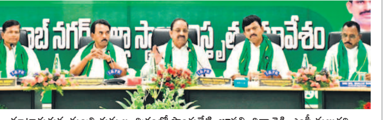
మాట్లాడుతున్న మంత్రి తుమ్ముల, చిల్లారేటి పొంగులేటి, జూపల్లి, చిన్నారెడ్డి, ఎంపీ మల్లారవి

దుర్బినియోగాన్ని లక్ష్యం చేసుకోవడం : పొంగులేటి రైతులను పథకం ద్వారా గతంలో జరిగిన దుర్బినియోగాన్ని నివారించడం కోసం రైతుల నుంచి అభిప్రాయాలు సేకరిస్తున్నామని రెవెన్యూశాఖ మంత్రి పొంగులేటి శ్రీనివాసరెడ్డి అన్నారు. కేవలం వ్యవసాయం చేస్తున్న రైతులకు మాత్రమే రైతు భరోసా అందించాలన్నది లక్ష్యమని, పథకం పేరుతో ప్రజలకు ఇచ్చే పరివరయం ప్రజల నుంచి వచ్చిందే ఇష్టం జరుగుతుందన్నారు. ప్రజలకు జవాబుదారీతనంగా ఉండాలన్న ఉద్దేశంతోనే ఓపెన్ డిబెట్ ద్వారా రైతుల అభిప్రాయం సేకరణ కొనసాగుతుందన్నారు. రైతు భరోసాపై ఇప్పటికే నిర్ణయం జరిగిందని చెప్పిన తర్వాత ప్రభుత్వ ప్రచారాలను రైతుల నమ్మి ధ్వంసం చేయకూడదన్నారు. అసంతోషం కలిగిన వారికి కార్యక్రమాలను ముగిసిన పొంగులేటి చెప్పారు. ప్రతి ఒక్కరూ ప్రజాసేవలో భాగస్వామి : మంత్రి జూపల్లి రైతు భరోసా పథకంలో ప్రతి ఒక్క ప్రజాసేవ జరిగినప్పుడు లక్ష్యంతోనే రైతు అభిప్రాయాల సేకరణకు ప్రభుత్వం శ్రీకారం చుట్టడం మంత్రి జూపల్లి అన్నారు. సీఎం రేపర్ట్లో రైతులకు అందించే సాయం పథకం ద్వారా ఒక్క రూపాయి కూడా నష్టం జరగడానికి వీలు లేకుండా చర్యలుంటాయన్నారు. గతంలో జరిగిన తప్పిదాలను మళ్ళీ జరగకుండా తగిన చర్యలు తీసుకోవడం జరుగుతుందన్నారు. ఎన్నికల్లో ఇప్పటికీ చూపిస్తున్నట్లుగా సీఎం రేపర్ట్లోని అమలు చేసే దిశగా ప్రభుత్వం అడుగులు వేస్తున్నదని మంత్రి వెల్లడించారు.