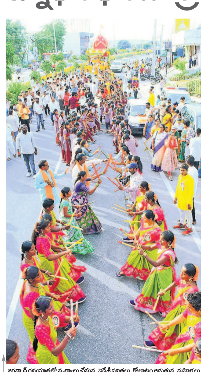
జగన్నాథ్ రథయాత్రలో నృత్యాలు చేస్తున్న విదేశీ వనితలు, కోలాటం ఆడుతున్న మహిళలు