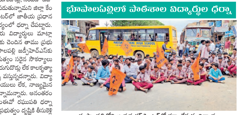
భూపాలపల్లిలోని జయశంకర్ సిబిటిలో ధర్నా చేస్తున్న విద్యార్థులు

వానలు లేక.. ఎత్తున సాగక అన్నది తలచుకున్నాడు. చెరువులు నిండక, ప్రాజెక్టులు నుండి నీరు రాక ఇబ్బందులు పడుతున్నాయి. వరిని నాట్లు అదును మొదలైనా.. నారు సిద్ధంగా ఉన్నా.. నాలుగే వేయలేని దుస్థితి నెలకొంది. అదేమీ దాటకుండా వరిని వర్రులకు వాణిజ్య పంటల సాగు జోరందు లుకా.. ప్రధాన ఆహార పంటల వరికి మాత్రం ప్రైవేటు వరిపత్తి తులు నలకొన్నాయి. ఇప్పటి వరకు ఉమ్మడి వరంగల్ జిల్లాలోని ములుగులో మాత్రమే మెరుగైన వర్ష పాతం నమోదు కాగా, మిగిలిన జిల్లాల్లో సాధారణంగానే ఉంది. సీజన్ ప్రారంభమై 42 రోజులు గడిచినా ఒక్క భారీ వర్షం కూడా నమోదు కాలేదు. అక్కడక్కడా భోధా, విపాడు కొండ రైతులు నాట్లు వేస్తున్నారు. మరో రెండు వారాల్లో వానలు పడకుంటే నారు ముదురుతుంది, ఆ తర్వాత కురిసినా ఫలితం ఉండదని అన్నది తలచుకున్నాడు.