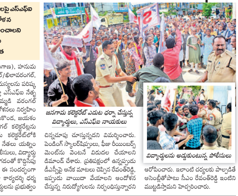
జనగామ కలెక్టరేట్ ఎదుట ధర్నా చేస్తున్న విద్యార్థులు, ఎన్ఎఫ్ఏ నాయకులు

విద్యారంగం సమస్యలపై ఎన్ఎఫ్ఏ నేతృత్వంలో ఆందోళన నిరవధించిన నేతలు జనగామలో కలెక్టరేట్