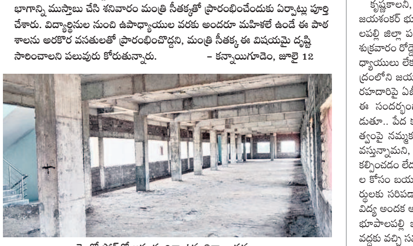
రెండో షిఫ్ట్లో అనంతర్యాగా ఉన్న నిర్మాణ పనులు