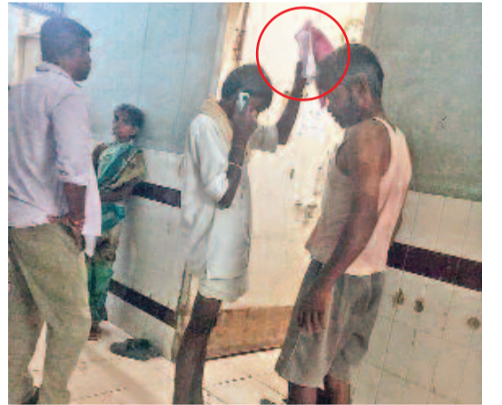
ఎంజీఎంలో అత్యవసర విభాగంలో చూడలేక కోసం క్యూలో ఉన్న రోగి, ఘోషించి బాటిల్ చేతిలో పట్టుకొని నిల్చున్న అరిందెంట్

అత్యవసర విభాగంలో పేషెంట్ కేర్ కరువు కనిపించని వైద్య సిబ్బంది.. ఇబ్బందులు పడుతున్న అరిందెంట్లు వరంగల్ చౌరస్తా, జూలై 13: రోగులతో నిత్యం రద్దీగావుండే వరంగల్ ఎంజీఎం దవాఖానాలోని అత్యవసర విభాగంలో పేషెంట్ కేర్ సిబ్బంది కనిపించడంలేదు. దీంతో రోగులు, అరిందెంట్లు ఇబ్బందులు పడుతున్నారు. ఒంటరిగా వైద్యసేవ కోసం వచ్చే వారి పరిస్థితి దయనీయంగావుంది. వైద్యులు సూపీ తులు కల్పించామని వైద్యాధికారులు చేతులు దులుపుతుంటున్నారని విమర్శలు వస్తున్నాయి. ఇప్పటికైనా అత్యవసర విభాగంలో మౌలిక వసతులతోపాటు పేషెంట్ కేర్ సిబ్బందిని ఏర్పాటు చేయాలని రోగులకు అందించాల్సిన ఘోషాల్సిన ఏర్పాటు చేసేందుకు అవసరమైన స్టాండ్స్ కూడా అందుబాటులో లేకపోవడంతో అరిందెంట్లు ఘోషించి బాటిల్స్ చేత పట్టుకొని నెలకొంది. అత్యవసర విభాగం ముందు నాలుగు వీల్ చెయిర్స్, స్టైల్స్ ఏర్పాటు చేసి రోగులకు అవసరమైన వసతులు కల్పించామని వైద్యాధికారులు చేతులు దులుపుతుంటున్నారని విమర్శలు వస్తున్నాయి. ఇప్పటికైనా అత్యవసర విభాగంలో మౌలిక వసతులతోపాటు పేషెంట్ కేర్ సిబ్బందిని ఏర్పాటు చేయాలని రోగులకు అందించాల్సిన ఘోషాల్సిన