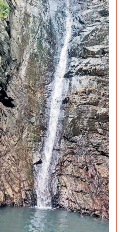
ఏడు బావుల జలపాతంలో జూలవారుతున్న నీటి ధార

బయ్యారం, జూలై 13 : బయ్యారం, గంగారం మండలాల సరిహద్దు అటవీ ప్రాంతంలో ఉన్న ఏడుబావుల జలపాతం జూలవారుతున్నది. కొన్ని రోజులుగా కురుస్తున్న వర్షాల నేపథ్యంలో ఏడుబావులో జలధార ప్రారంభమైంది. పచ్చని గుట్టల మధ్య సల్లని రాళ్లపై తెల్లటి ముత్యాలు దొర్లినట్లుగా నీరు ఒక బావి నుంచి కింద ఉన్న మరో బావి కింద ఉన్న మరో బావి కింది పడుతున్న దృశ్యాలు చూచుకుంటే ఆకట్టుకుంటున్నాయి. ఈ జలపాతాన్ని చూసేందుకు సందర్శకుల రాక ప్రారంభమైంది.