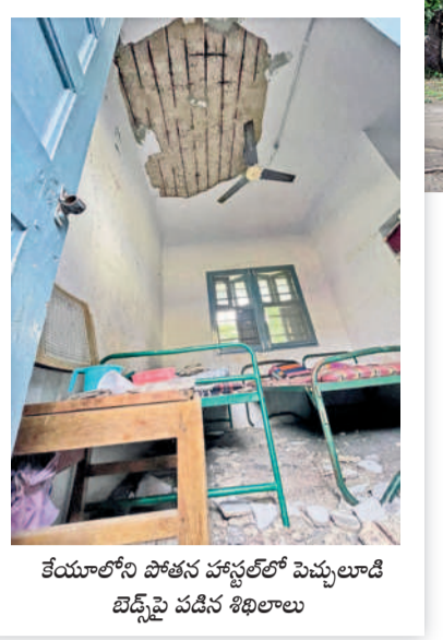
కేయూలోని హాస్టల్లో పెచ్చులాడి బెడ్స్పై పడిన శిశుులు