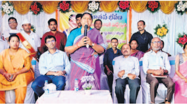
గోవిందరావుపేట : చల్లారాలో మాట్లాడుతున్న మంత్రి సీతక్క, అదనపు కలెక్టర్ దివారక, అదనపు కలెక్టర్ శ్రీజిత

తాడ్యాయి / గోవిందరావుపేట / కన్యాయిగుడెం / ఏటూరునాగారం, జూలై 13 : గిరిజన గ్రామాలలోని సమస్యల పరిష్కారానికి ప్రభుత్వం ప్రణాళికలు సిద్ధం చేస్తున్నదని రాష్ట్ర పంచాయతీరాజ్ శాఖ మంత్రి సీతక్క అన్నారు. శనివారం ఆమె తాడ్యాయి, గోవిందరావుపేట, కన్యాయిగుడెం, ఏటూరునాగారం మండలాల్లో పర్యటించారు. తాడ్యాయి మండలం పోచారంలో కంట్లినే సబ్ సెంటర్, గోవిందరావుపేట మండలం చల్లారాలో రూ. 1.35 కోట్లతో నిర్మించిన కన్యారా గాంధీ బాలికల విద్యాలయ తరగతి గదులు, వసతి భవనం, కన్యాయి గూడెం మండలం మున్నపల్లిలో రూ. 3.50 కోట్లతో కన్యారా గాంధీ బాలికల ఆశ్రమ పాఠశాల నూతన భవనం, ఏటూరునాగారం మండలంలోని అల్లవారి ఘనపూర్లోని పల్లె దవాఖానం (సబ్ సెంటర్) భవనాన్ని కలెక్టర్ దివారక, ఎస్పీ శబరీష్, అదనపు కలెక్టర్ శ్రీజితో కలిసి మంత్రి ప్రారంభించారు. తాడ్యాయి మండలం లింగాల గ్రామంలో ప్రజాదర్శన నిర్వహించారు. ఈ సందర్భంగా ప్రజల నుంచి రోడ్డు, విద్యుత్, వైద్యం, బస్సు, జీసీటీ డిపో, పోడు పట్టణ తదితర సమస్యలపై వివరాలను స్వీకరించారు. వేర్వేరుగా జరిగిన ఈ కార్యక్రమాల్లో మంత్రి సీతక్క మాట్లాడారు. గిరిజన గ్రామాల ప్రజలు వైద్యం అందక