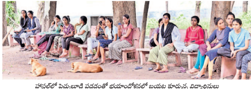
హాస్టల్లో పెచ్చులాడి పడడంతో భయాందోళనలో బయట కూర్చున్న విద్యార్థినులు

సమ్మక్క-సారలమ్మ హాస్టల్ కేటాయింపు పోతన గర్ల్స్ హాస్టల్ విద్యార్థినులకు నూతనంగా నిర్మించిన సమ్మక్క-సారలమ్మ హాస్టల్ ను కేటాయింపారు. కొత్తగా 200 బెడ్స్ అర్ధ రిజిస్ట్రార్ మని, అవి పచ్చిని తర్వాత పిప్పి చెదామనుకున్న క్రమంలో ఈ ఘటన జరిగిందని రిజిస్ట్రార్ మల్లారెడ్డి తెలిపారు. దీంతో పాత బెడ్స్ తోనే విద్యార్థినులను నూతన హాస్టల్లోకి మారుస్తున్నట్లు పేర్కొన్నారు.