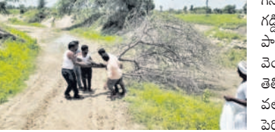
రామకృష్ణ శివారంలోని కాలువలో పెరిగిన తుమ్మ చెట్లను తొలగిస్తున్న సిబ్బంది

నాగిరెడ్డిపేట, జూలై 13 : మండలం కాలువకు ఇరువక్కల పెరిగిన వాటిని లోని పోచారం ప్రధాన కాలువలో పెరిగి తొలగిస్తున్నామని తెలిపారు.