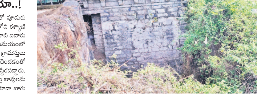
కళ్యాణి గ్రామ శివారంలో మెట్ల బావి చుట్టూ పెరిగిన వీధిమొక్కలు, ముక్కోడలు

ఎల్లారెడ్డి, జూలై 13 : పురాతన మెట్ల బావి చెత్త చెదారంతో పూడుకు పోయిందని, దానికి బాగు చేయాలని ఎల్లారెడ్డి మండలంలోని కళ్యాణి గ్రామస్థులు కోరుతున్నారు. కళ్యాణి గ్రామంలో ఉన్న మెట్ల బావి బదలారు దశాబ్దాల క్రితం ఓ వెలుగు వెలిగింది. స్వాతంత్ర్యోద్యమ సమయంలో చురుగ్గా పోరాటం చేసిన రాజకీయ పార్టీలకు కళ్యాణి గ్రామస్థులు పోరాటం చేశారు. కాలక్రమేణా ఎల్లారెడ్డి పట్టణం అభివృద్ధి చెందడంతో కళ్యాణి గ్రామం ప్రముఖులు, వ్యాపారులు ఎల్లారెడ్డికి వచ్చి స్థిరపడ్డారు. దీంతో ఆ గ్రామం మరుగునపడింది. ఎల్లారెడ్డిలోని రెండు మెట్ల బావులను కల్పిం బాగుచేయాలని, తమ గ్రామంలోని మెట్ల బావిని కూడా బాగు చేయించాలని కళ్యాణి గ్రామస్థులు కోరుతున్నారు.