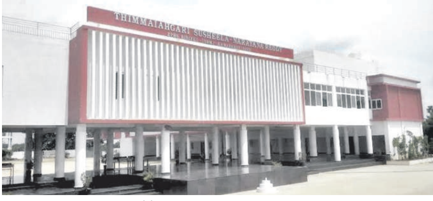
బీబీపేట్లోని ప్రభుత్వ జూనియర్ కళాశాల

బీబీపేట్, జూలై 13 : మండల కేంద్రంలోని ప్రభుత్వ జూనియర్ కళాశాల సమస్యల వలయంలో కొట్టుమిట్టాడుతున్నది. గత బీఆర్ఎస్ ప్రభుత్వం బీబీపేట్ ను నూతన మండలంగా ఏర్పాటు చేసి జూనియర్ కళాశాలను మంజూరు చేసింది. బాలర ఉన్నత పాఠశాలలో మూడు గదులు తీసుకొని కళాశాలను ప్రారంభించారు. దోమకొండ కళాశాల ప్రిన్సిపాల్ కు కళాశాల బాధ్యతలను అప్పగించారు. గతేడాది జూలై 8వ తేదీన ఏర్పడిన జూనియర్ కళాశాలలో టైటిల్స్, ఎంపీసీ, సీఈసీ, హెచ్ఈసీ గ్రాంట్లలో 45 మంది విద్యార్థులు అడ్మిషన్లు తీసుకున్నారు. అధ్యాపకులు లేకపోవడంతో దాత సహకారంతో నలుగురు ప్రైవేట్ లెక్చర్లర్లను నియమించారు. కళాశాలకు మొత్తం 12 మంది లెక్చర్లర్లు కావాలి ఉంది. కానీ.. నలుగురు ప్రైవేట్ లెక్చర్లర్లతో 45 మంది విద్యార్థులకు అన్ని సబ్జెక్టులు బోధించడంలో విద్యార్థులు శ్రద్ధ పెట్టకపోవడంతో 45 మందిలో ఒక్కరు కూడా పాస్ కాలేదు.