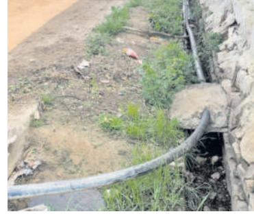
మురికి కాలువలో ఏర్పాటు చేసిన పైపులైన

నాగిరెడ్డిపేట, జూలై 13 : మండలంలోని వడలేపల్లి గ్రామంలో తాగునీటి పైపులైనను డ్రైనేజీలో నుంచి ఏర్పాటు చేశారు. దీంతో కలుషిత నీరు సరఫరా అవుతున్నదని గ్రామస్థులు ఆవేదన వ్యక్తం చేస్తున్నారు. గ్రామంలోని పాత గ్రామ పంచాయతీ భవనం పక్కనే కొత్తగా బోరుబావిని తవ్వించి మోటరు చేసినారు. కాటన్ నీరు సరఫరా చేసినారు పైపులైనను డ్రైనేజీలో నుంచి ఏర్పాటు చేశారు. అధికారులు స్పందించి పైపులైనను డ్రైనేజీలో నుంచి తొలగించేలా చూడాలని గ్రామస్థులు కోరుతున్నారు.