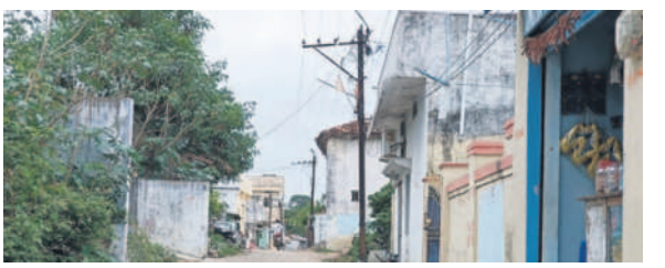
బిచ్చంపేటలో ఇనుప స్తంభాలు, బిచ్చంపేట అసెంబ్లీ ఉన్న స్తంభాలు

బిచ్చంపేట, జూలై 13 : విద్యుత్ లైన్ల కోసం గతంలో ఇనుప స్తంభాలను ఏర్పాటు చేశారు. వాటితో ప్రమాదాలు సంభవిస్తున్నాయి. క్షేత్ర ఉండడంతో క్రమంగా సిమెంట్ స్తంభాలు ఏర్పాటు చేస్తున్నారు. కానీ.. ఇప్పటికీ పలు గ్రామాల్లో ఇనుప స్తంభాలే ఉన్నాయి. వీటి ద్వారా ప్రమాదాలు జరుగుతాయని ప్రజలు ఆందోళన వ్యక్తం చేస్తున్నారు. వాటి స్థానంలో సిమెంట్ స్తంభాలను ఏర్పాటు చేయాలని కోరుతున్నారు. గతంలో