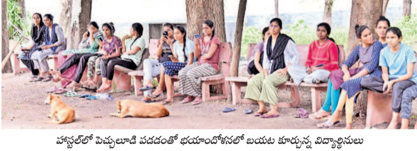
హాస్టల్లో పెచ్చులాడి పడడంతో భయాందోళనలో బయట కూర్చున్న విద్యార్థులు