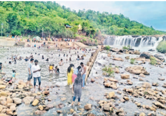
స్విమ్మింగ్ పూల్లో పర్యాటకులు

వాజేడు, జూలై 13 : బొగత జల పాతాన్ని చూసి పర్యాటకులు ఫిదా అవుతున్నారు. శనివారం రాష్ట్రంలోని వివిధ ప్రాంతాల నుంచి ప్రజలు పెద్ద ఎత్తున తరలివచ్చారు. జలపాతం వద్ద ఉన్న స్విమ్మింగ్ పూల్లో స్నానాలు చేస్తూ ఎంజాయ్ చేశారు. చుట్టూ ఉన్న పచ్చని చెట్లు వారిని మంత్రముగ్ధులను చేశాయి. జల పాతం పూర్వ పాతంలో నుంచి బొగత అందాలను హూస్ సాగిలు దిగారు.