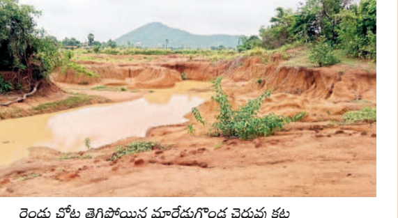
రెండు కోట్ల తెగిపోయిన మారేడుగొండ చెరువు కట్ట