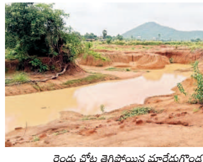
రెండు చోట్ల తెగిపోయిన మారేడుగొండ చెరువు కట్ట