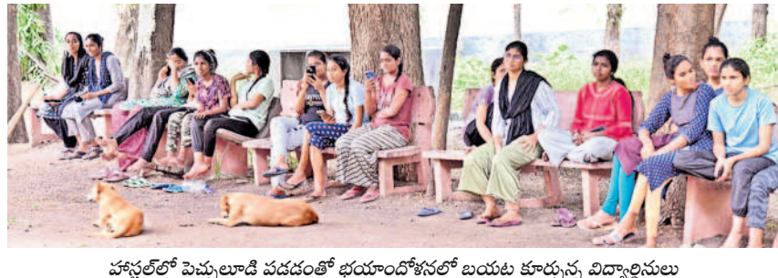
హాస్టల్లో పెచ్చులూడి పడడంతో భయాందోళనలో బయట కూర్చున్న విద్యార్థినులు