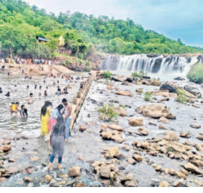
స్క్వింజింగ్ పూల్లో పర్యాటకులు

వాజేడు, జూలై 13 : బొగత జల పాతాన్ని చూసి పర్యాటకులు ఫిదా అవుతున్నారు. శనివారం రాష్ట్రంలోని వివిధ ప్రాంతాల నుంచి ప్రజలు పెద్ద ఎత్తున తరలివచ్చారు. జలపాతం వద్ద ఉన్న స్క్వింజింగ్ పూల్లో స్నానాలు చేస్తూ ఎంజాయ్ చేశారు. చుట్టూ ఉన్న పచ్చని చెట్లు వారిని మంత్రముగ్ధులను చేశాయి. జల పాతం పూర్వ పాతంలో నుంచి బొగత అందాలను చూస్తూ సీల్స్ దిగారు.