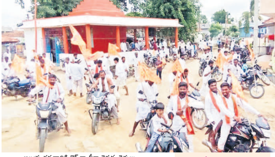
అలయ దర్శనానికి బైక్ ర్యాలీగా వెళ్తున్న రైతులు

శ్రీరాంసాగర్ జలాశయ తీరాన ఆకాశంలో అద్భుత దృశ్యం ఆవిష్కృతమైంది. సాయంకాల సమయంలో నీలిమబ్దులు కనువిందు చేశాయి. ఆకాశంలోని నీలి మేఘాల ప్రతిబింబం అలలపై తేలియాడుతూ చూపరు మనసు దోచుకున్నది. సుదూరంలో ఆకాశం, నీరు కలిసి పోయినట్లు కనిపిస్తున్న ఈ సుందర దృశ్యాన్ని నమస్తే తెలంగాణ క్లిక్ మునిపించింది. సాగర తీరం.. అద్భుత దృశ్యం