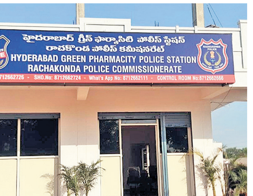
యాచారం మండలం మేడిపల్లిలో అద్దె భవనంలో ఏర్పాటు చేసిన హైదరాబాద్ గ్రీన్ పార్కానిటీ పోలీస్ స్టేషన్