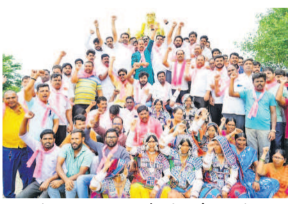
అంతర్జాతీయ విగ్రహం ఎదుట ఆందోళన చేస్తున్న బీఆర్ఎస్ శ్రేణులు

జిల్లా రైతాంగానికి ఎలాంటి ఇబ్బందులు తలెత్తకుండా సరిపడా ఎరువులను అందుబాటులో ఉంచారు. జిల్లాలోని ప్రతి గ్రామ పంచాయతీలోనూ ఏకవోలు క్లెక్ షాపులలో పంటల సర్వీ నిర్వహిస్తుండ