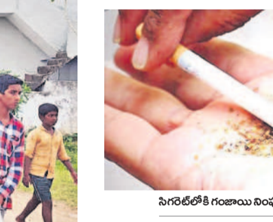
సిగరెట్ లోకి గంజాయి నింపుతున్న దృశ్యం