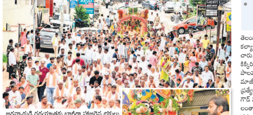
జగన్నాథుడి రథయాత్రకు భారీగా హాజరైన భక్తులు

పాలమూరు, జూలై 14 : మహాబూబ్ నగర్ జిల్లా కేంద్రంలోని తిరుమల తిరుపతి దేవస్థానం కల్యాణ మండలం నుంచి శ్రీ జగన్నాథ స్వామివారి రథయాత్రను ఆదివారం వైభవంగా నిర్వహించారు. కొత్తబస్తాన్, అశోకాక్షయి వారస్థాన, వనపర్తి పోలీస్ స్టేషన్ వారస్థాన, రాంమందిరం నుంచి గడియారం వారస్థానం వరకు ప్రధాన కార్యదర్శి పూడికత్తి తీవ్ర ఆలోచన పనులు చేపడుతున్నారు. 2022-23 సంవత్సరంలోనే తెలంగాణ తొలి సీఎం కేసీఆర్ ప్రభుత్వం రూ.36లక్షలు విడుదల చేసి పనులు కాంట్రాక్టర్ కు అప్పగించింది. గతేడాది పూడికత్తి, ముఖ్యకంపెనీ తొలగించి పనులు చేపట్టడంలో ఆలస్యమైంది. ఈ