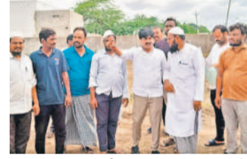
శ్వాసవాటికను పరిశీలిస్తున్న అలంపూర్ ఎమ్మెల్యే

డిగ్రీ చదువుకు రూ.25వేలు, విద్యార్థి భరోసా కింద రూ.5లక్షల హామీలు విమయ్యాయని ప్రకారమన్నారు. ప్రభుత్వ వైఫల్యాలను ఎప్పుడీకప్పుడు సోషల్ మీడియాలో ప్రజలకు వివరించాలన్నారు. అభిప్రాయ సేకరణలకు రైతులను సభ్యులు ముందస్తుగా కాంగ్రెస్ చూస్తున్నారన్నారు. రైతులు అప్రమత్తంగా ఉండాలని పిలుపునిచ్చారు. ఎమ్మెల్యేలను తులం బంగారం, మహిళలకు రూ.2,500 నగదు, కేసీఆర్ కిట్లు, గ్యాస్ సబ్సిడీ, విద్యార్థులకు స్కూలీలపై నిలవీస్తున్నారని చెప్పారు. హామీల అమలు కోసం నిర్మాణాత్మక ఉద్యమాలు చేస్తామన్నారు. 14వ పండ్ల ఉద్యమం చేసిన హాస్యంలో సునామి నృత్యంగిని కేసీఆర్ తెలంగాణ ఉద్యమంలో ఎందరో యువ నాయకులను తయారు చేశారని గుర్తుచేశారు. అలాగే కష్టకాలంలో పార్టీ కోసం పనిచేసిన కార్యకర్తలను నాయకులుగా తయారు చేస్తామన్నారు. ప్రతి మండలంలోని యువ, విద్యార్థి అత్యయ సమ్మేళనాలు నిర్వహించి యువ శక్తిని తయారు చేస్తామన్నారు.