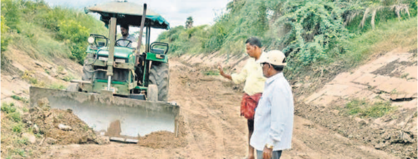
ఆర్డిఎస్ కాలనీలో డోజర్ తో పూడికత్తి పనులు చేయిస్తున్న ఏక రాండాన్

• రూ.36లక్షల వ్యయంతో పనులు • కేసీఆర్ ప్రభుత్వ హయాంలోనే నిధుల మంజూరు అయితే, జూలై 14 : ఆర్డిఎస్ ప్రధాన కార్యదర్శి పూడికత్తి తీవ్ర ఆలోచన పనులు చేపడుతున్నారు. 2022-23 సంవత్సరంలోనే తెలంగాణ తొలి సీఎం కేసీఆర్ ప్రభుత్వం రూ.36లక్షలు విడుదల చేసి పనులు కాంట్రాక్టర్ కు అప్పగించింది. గతేడాది పూడికత్తి, ముఖ్యకంపెనీ తొలగించి పనులు చేపట్టడంలో ఆలస్యమైంది. ఈ