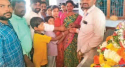
మృతదేహాధికారికి ఆర్థికసాయం అందజేస్తున్న అసోసియేషన్ నాయకులు