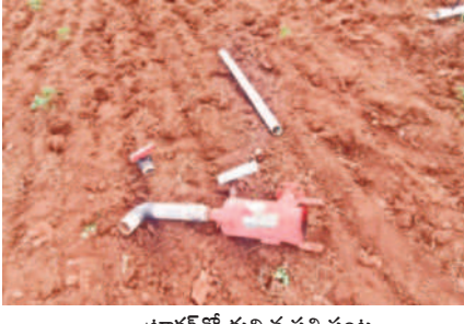
ట్రాక్టర్ తో దున్నిన పత్తి పంట