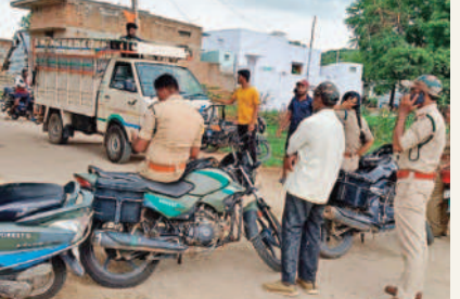
శ్శశాన వాటిక పనులను అడ్డుకుంటున్న పారెస్ అధికారులు