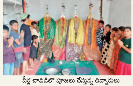
పీర్ చాచిడిల్లో పూజలు చేస్తున్న చిన్నారులు

వడ్డెల్లి, జూలై 14: కుటుంబాలకు అతితగా అందరూ నిర్వహించుకునే పీర్ల పండుగ వేడుకలు మండలంలోని అయిలా మహల్లో ప్రారంభమయ్యాయి. కొంతకాల గ్రామంలో ఆదివారం చిన్నారులు పీర్ల చాచిడి వద్ద సంఘడి చేశారు. పూజలు అనంతరం చాచిడి మండల ఏర్పాటు చేసిన అలాయ్ గుంత చుట్టూ కేరింపుల కొడుతూ ఆడారు. పాఠశాలకు నిలవులు కావడంతో ఎక్కువ సమయం అలాయ్ గుంత వద్ద ఆడుతూ కనిపించారు.