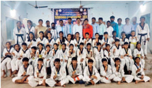
మెడల్స్ పొందిన విద్యార్థులతో మాట్లాడు