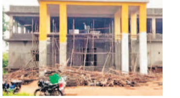
అసంపూర్ణంగా సెంట్రల్ మెడికల్ స్టోర్

మందుల కొరతను తీర్చేందుకు ముందస్తు చర్యలు కనిపించడం లేదు. వానకాలం, ఎండకాలంలో ప్రధానంగా సీజనల్ రోగాలు ప్రజలను ఇబ్బందులకు గురి చేస్తుంటాయి. ఎండకాలంలో వడదెబ్బ ప్రభావం చూపిస్తే వానకాలంలో డెంగ్, మలేరియా, డబ్బెరియా, టైఫాయిడ్, పాము కాట్లు, కుక్కకాట్లు లాంటి రోగాలు ఇబ్బందులు కలిగిస్తుంటాయి. ముఖ్యంగా నల్లమల ప్రాంతమైన నాగర్ కర్నూల్ జిల్లాలోని కొల్లూపూర్, అప్పారెడ్డిలోని చెంచు పెంజిలు, అటవీ పరిసర గ్రామంలో డిబ్బెరియా సంక్రమిత వ్యాధుల ప్రభావం ఎక్కువగా ఉంది. ఈ ప్రాంతాల్లోని ప్రజలు అనారోగ్యానికి గురైతే దవాఖానలకు వెళ్లడం వరకే కాలయాపన జరుగుతుంటుంది. ఇక సమీప దవాఖానలకు వెళ్లేసరికి సంబంధిత మాత్రలు లేవో వరకం పరిపాలనా మారినది. జిల్లాలోని పలు సంఘాలను వైద్యశాఖ తీరుపై విమర్శలకు లక్ష్యం చేసింది. ఇదిలా ఉంటే విశాఖ ప్రభుత్వం జిల్లాలో మందుల కొరతను తీర్చేందుకు బీఆర్ఎస్ ప్రభుత్వం రూ. 3.80 కోట్లతో సెంట్రల్ మెడికల్ స్టోర్లను మంజూరు చేసింది. బిజినెస్ గేట్ మండుం పాలెం వీహెచ్సీ ఆవరణలో గతేడాది జూలై 30వ తేదీన పనులకు శంకుస్థాపన చేశారు. ఇది జరిగి ఏడాది కావచ్చున్నా