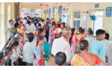
గద్దాల దవాఖానలో కిక్కిరిసిపోతున్న రోగులు

ఉమ్మడి జిల్లాలో వర్షాలు సమృద్ధిగా కురుస్తున్నాయి.. ఎడతెలిసలేని వానలతో గ్రామాల్లో రోడ్లన్నిటికీ కూడా తాగునీరు కలుషితమయ్యే ప్రమాదం ఉంది. మరోవైపు చలిగాలులు విపరీతంగా వీస్తున్నాయి. డోమల బెడద కూడా ఎక్కువైంది. గ్రామాల్లో సర్పంచల పాలన లేకపోవడంతో పారిశుధ్యం పూర్తిగా పడకనింది. ఫలితంగా జనం రోగాల బారిన పడుతున్నారు. ఇదివరకే సీజనల్ వ్యాధుల ప్రభావంతో ఉమ్మడి జిల్లాలోని జిల్లా దవాఖానలు, ఏరియా ఆసుపత్రులు, ప్రైవేట్ హాల్స్ సెంటర్ల రోగులతో కిక్కిరిసిపోతున్నాయి. అయితే వైద్య ఆరోగ్యశాఖ అప్రమత్తమై జనాలకు డ్రైప్ లైన్ల వారీకి సరైన మందులు ఇవ్వడంలో మాత్రం విఫలమవుతున్నారు. రాష్ట్రంలో కాంగ్రెస్ సర్కారు కొత్తగా వచ్చినప్పటి నుంచి ఇప్పటి వరకు సర్కారు దవాఖానల్లో మందులకు నయం పైసా విడుదల చేయలేదు. ఫలితంగా రోగులకు డ్రైప్ లైన్ల ఇన్స్టా