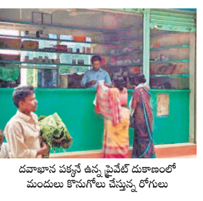
దవాఖాన పక్కనే ఉన్న ప్రైవేట్ దుకాణంలో మందులు కొనుగోలు చేస్తున్న రోగులు

గద్దాలలో, జూలై 15 : గద్దాల జిల్లా దవాఖానలో ప్రతిరోజూ 600కు పైగా టెట్ పేషెంట్లు వస్తుంటారు. అలాగే దవాఖానలో దాదాపు 280మంది వరకు రోగులు చికిత్స పొందుతున్నారు. తమ జబ్బులు నయం చేసుకునేందుకు వచ్చే రోగులకు సిబ్బంది చిరునవ్వులతో పాటు సరైన మందులు లేకపోవడం తీవ్ర ఇబ్బందులకు గురి చేస్తున్నాయి. ప్రైవేట్ వైద్యశాలలో చూపించుకోలేక, సర్కారు దవాఖానలో సరైన మందులు దొరక్కా వానా అవ్వవు పడతా వస్తుంది. మంచి మందులు కావాలంటే బయటటి రాసిస్తాం తెచ్చుకోవడం వైద్య సిబ్బంది చెబుతున్నారని రోగులు వాపోతున్నారు. ఆ డబ్బులే ఉంటే గవర్నమెంట్ కు దవాఖానకు ఎందుకొస్తామన్న ప్రశ్నలు వినిపిస్తున్నాయి. ప్రభుత్వం మారితే మంచి వైద్యం లభిస్తుందనుకుంటే కొండనాలకు మందు వేస్తే ఉన్న నాలిక ఊడినట్లంది అని రోగులు ఆవేదన వ్యక్తం చేస్తున్నారు. కాగా సీజనల్ వ్యాధులైన డబ్బెరియా, ఇతర అంటు రోగాలకు సంబంధించిన మందుల కొరత వినిపిస్తున్నారని, అన్ని మందులు అందుబాటులో ఉన్నాయని వైద్యాధికారులు చెబుతున్నారు.