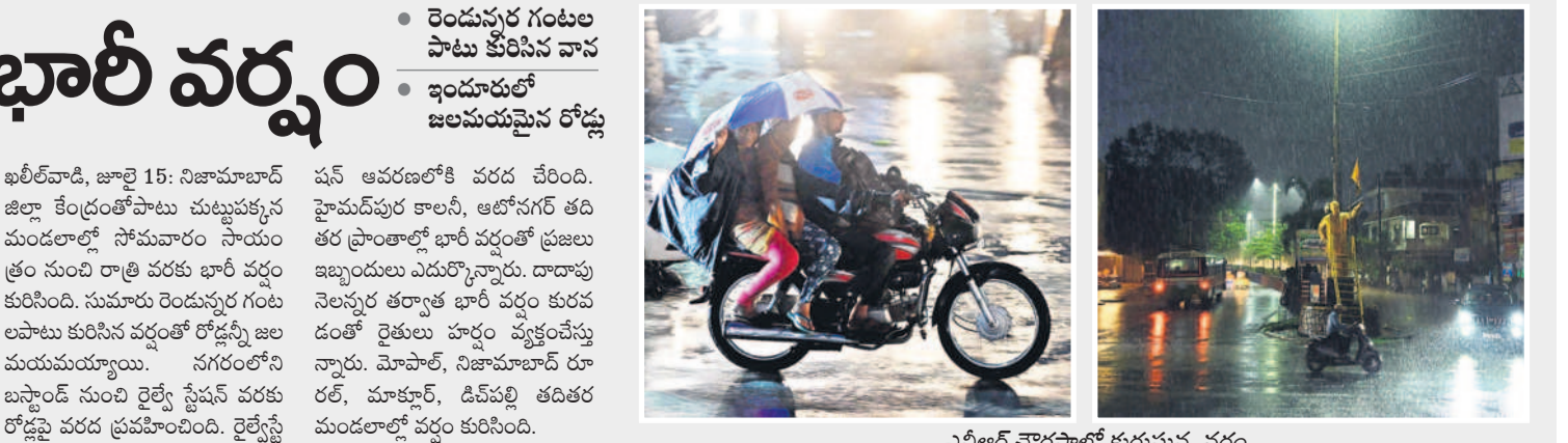
ఎన్టీఆర్ చౌరస్థాలో కురుస్తున్న వర్షం