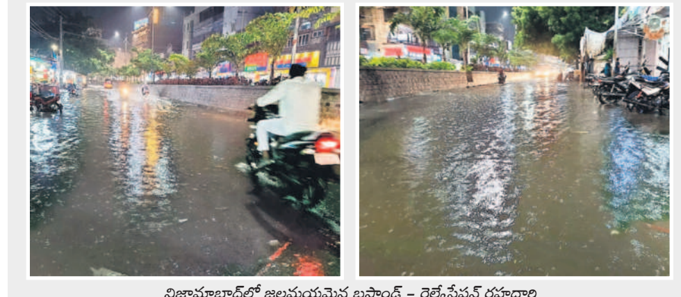
నిజామాబాద్ లో జలమయమైన బస్టాండ్ - రైల్వే స్టేషన్ రూపాదారి

కామారెడ్డి, జూలై 15: పెన్ననర్ల సమస్యలు పరిష్కరించాలని డిమాండ్ చేస్తూ కామారెడ్డి కలెక్టరేట్ ఎదుట పెన్ననర్ల సోపానం నిరసన తెలిపారు. ఈ సందర్భంగా వారు మాట్లాడుతూ నాలుగు విధాలైన సమస్యలు పరిష్కరించాలని డిమాండ్ చేస్తూ కామారెడ్డి కలెక్టరేట్ ఎదుట పెన్ననర్ల సోపానం నిరసన తెలిపారు. ఈ సందర్భంగా