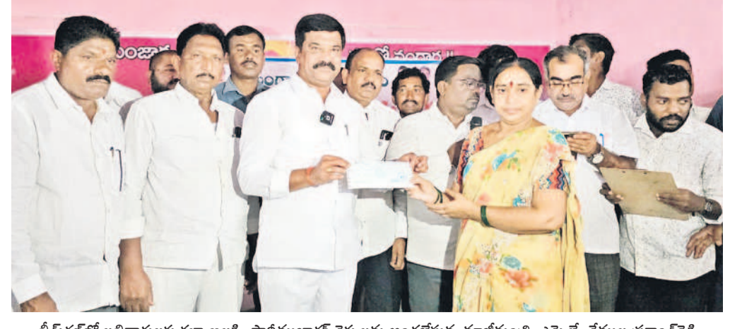
భీమ్గల్ లో లబ్ధిదారులకు కల్యాణలక్ష్మి, పోడిముబారక్ చెక్కులను అందజేస్తున్న మాజీమంత్రి, ఎమ్మెల్యే వేముల ప్రకాశ్ రెడ్డి

ఉమ్మడి జిల్లాల ప్రాటోకాల్ రగడ • అధికార పార్టీకి యంత్రాంగం వత్తాసు • నిబంధనలకు విరుద్ధంగా వ్యవహారాలు • కాంగ్రెస్ లీడర్లకి ప్రాధాన్యమిస్తున్న వైనం • ఎమ్మెల్యేలకు గౌరవం ఇవ్వకుండా నిర్ణయం • శాసనసభ స్పీకర్ కు ఫిర్యాదుల పరంపర • కనీసం పట్టించుకోని జిల్లా ఉన్నతాధికారులు