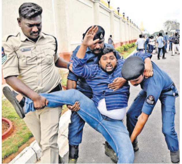
సచివాలయం వద్ద విద్యార్థి నేతలను అదుపులోకి తీసుకుంటున్న పోలీసులు

చిక్కడపల్లిలోని సెంట్రల్ రైల్వే వద్ద తీవ్ర ఉద్యోగ పరిస్థితులు నెలకొన్నాయి. నిరుద్యోగ యువకులు మోసాబీ మెరుపు సమ్మెకు దిగారు. బాటి సమ్మెలో హాజరైన యువకులు రాష్ట్రీక బయలుదేరినందుకు ప్రయత్నిస్తుండడంతో పోలీసులు అడ్డుకున్నారు. రైల్వే గేట్లు వేసి వారిని బయటకు రాకుండా అడ్డుకున్నారు. ఈ సందర్భంగా పోలీసులతో వాగ్వివాదం చోటు చేసుకుంది. పలువురు యువకులు తమ నిరసన వ్యక్తం చేస్తూంటూ గేట్ల తాళాలు తొలగించుకొని బయటకు వచ్చారు. వారిని పోలీసులు అరెస్టు చేశారు.