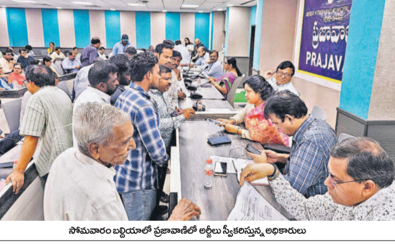
సోమవారం బల్లియాలో ప్రజావాణిలో అభ్యర్థుల సమస్యలపై అధికారులు