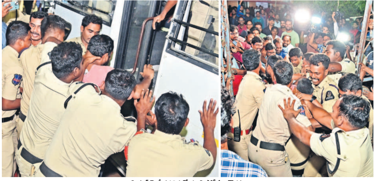
సెంట్రల్ రైల్వే వద్ద నిరుద్యోగులపై పోలీసుల దౌర్జన్యం