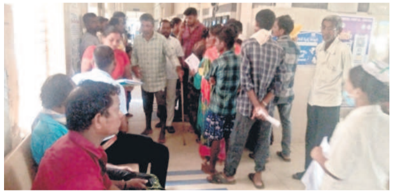
ఆసిఫాబాద్ జిల్లా కేంద్రంలోని ప్రభుత్వ దవాఖానకు చికిత్సకోసం వచ్చిన రోగులు

● కనీసం జ్వరం, జలుబుకు కూడా దొరకని దుస్థితి ● ప్రెస్క్రిప్షన్ తీసుకెళ్లి బయట తీసుకోవాలని సూచిస్తున్న ఫార్మసీ సిబ్బంది ● రోగులపై మోయలేని ఆర్థిక భారం