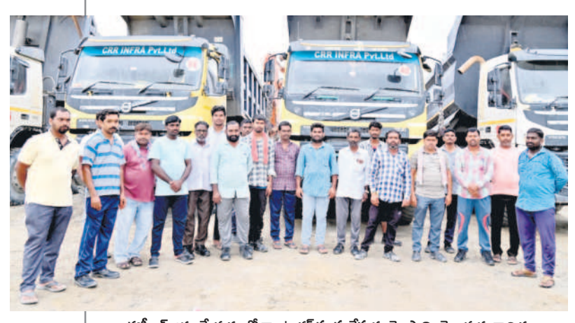
ఈమీప్ జమ చేయడంలో కాంట్రాక్టర్ సంస్థ చేస్తున్న మోసాన్ని చెబుతున్న కార్మికులు