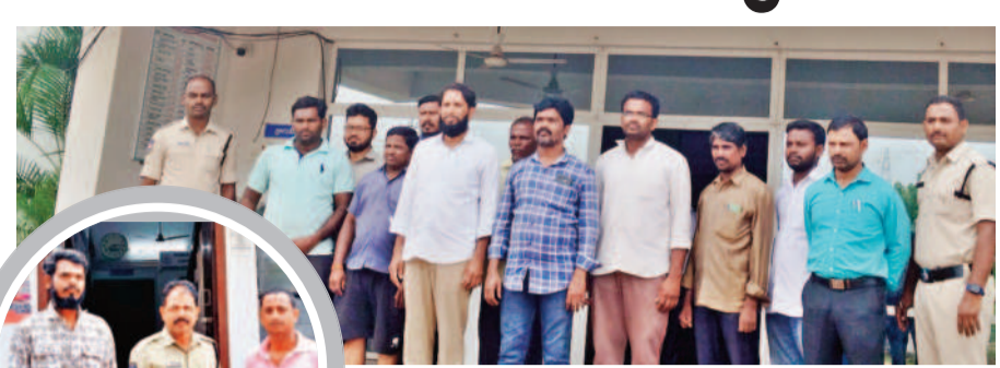
అయిజ రాజా వద్ద బీఆర్ఎస్, నిరుద్యోగి జాబ్ నాయకులు

అలంపూర్, జూలై 15: నాటి ప్రతిమొక్కనూ కాపాడాలి