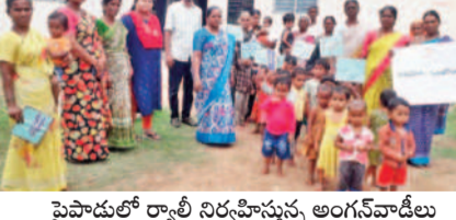
పైసావేళలో రాల్గిని నిర్వహిస్తున్న అంగన్వాడీలు