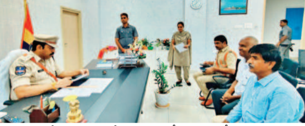
పోలీస్ ప్రజావాణిలో ఫిర్యాదులను స్వీకరిస్తున్న ఎస్.ఆర్.గిరిధర్

వనపర్తి టౌన్, జూలై 15 : బాధితులకు సత్వర న్యాయం జరిగేలా చూడాలని ఎస్.ఆర్.గిరిధర్ కిందిస్తూ సీబిఎం డి కి సూచించారు. సోమవారం జిల్లా కేంద్రంలోని పోలీస్ కార్యాలయంలో నిర్వహించిన ప్రజావాణిలో ఎస్.ఆర్.గిరిధర్ న్యాయం చేసేటట్లుగా ఫిర్యాదులను స్వీకరించారు. ఫిర్యాదులతో ఆయన స్వయంగా మాట్లాడి సమస్యలను అడిగి తెలుసుకున్నారు. ఈ సంద