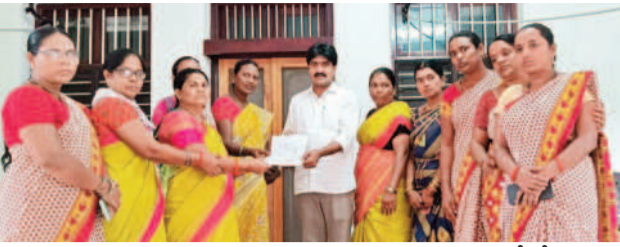
ఎమ్మెల్యే విజయకుడి వినతి పత్రం అందజేస్తున్న అంగన్వాడీ టీచర్లు

రాజోలి, జూలై 15: కేసీఆర్ సారథ్యంలోని ప్రభుత్వం సీఎం రిలీఫ్ ఫండ్ ద్వారా పేద ప్రజలకు అండగా నిలిచిందని అలంపూర్ ఎమ్మెల్యే విజయకుడు అన్నారు. సోమవారం మండలంలోని రాజోలి, మాన్డోడ్డి, ముండ్లదిన్నె, తుమ్మల తదితర గ్రామాల్లో సీఎం రిలీఫ్ ఫండ్ నుంచి మంజూరైన లబ్ధిదారులకు నేరుగా తమ ఇంకాకు వెళ్లి చెక్కులు అందజేశారు. బీఆర్ఎస్ శ్రేణులు ప్రజలకు అండగా ఉంటూ సమస్యలను తమ దృష్టికి తేవాలని ఎమ్మెల్యే సూచించారు. కార్యక్రమంలో పాల్గొని ముఖ్యశ్రేణులు,