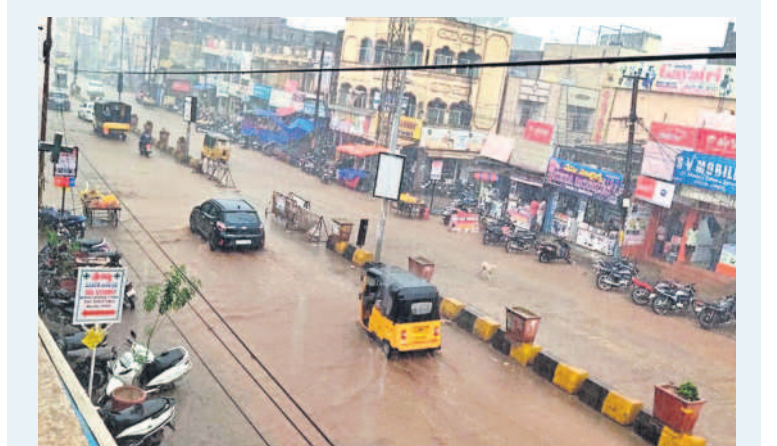
వికారాబాద్ జిల్లా కేంద్రంలో కురుస్తున్న వర్షం