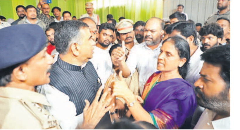
ప్రాబోకాల్ పాటించకపోవడంతో నిరసన వ్యక్తం చేసిన మాజీ మంత్రి సబితా ఇంద్రారెడ్డి

మంత్రి, ఎమ్మెల్యే సబితా ఇంద్రారెడ్డి మాట్లాడుతూ... ప్రాబోకాల్ పాటించకుండా, ప్రజలతో ఎన్నుకున్న ఎమ్మెల్యేలను ఆగెరపరుస్తున్నారని, ప్రజాప్రతినిధులను గౌరవించే సంప్రదాయాన్ని సీఎం రేపంకొరెడ్డి నేరుకొవాలన్నారు. ఎమ్మెల్యేతో పాటు ఓడిపోయిన అభ్యర్థి కూడా స్టేజీ మీద ఉన్నారంటే, సీఎం రేపంకొరెడ్డి కూడా కొడంగల్ లో తనపై ఓడిపోయిన అభ్యర్థిని తీసుకొచ్చి ప్రభుత్వ కార్యక్రమాల్లో స్టేజీపై తన పక్కన కూర్చోబెట్టుకొనే