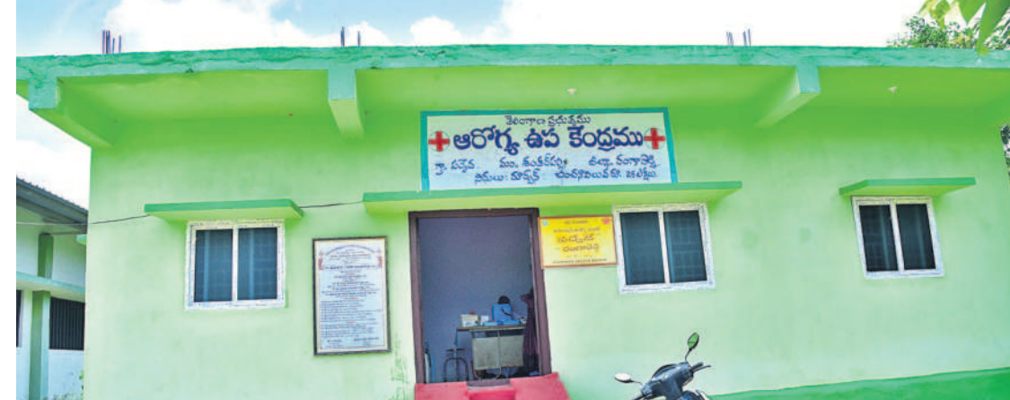
వేసుకునే మక్కల మందులు సైతం అందుబాటులో లేవు. ఉమ్మడి జిల్లాలోని చాలా పరకు ప్రభుత్వ ఆసుపత్రిలది దాదాపు ఇదే పరిస్థితి.

సీజనల్ వ్యాధులతో దవాఖానాల్లో పెరిగిన ఓపీ రద్దీకి తగ్గట్టుగా మందులు లేక అవస్థలు పడుతున్న రోగులు