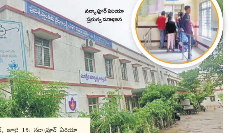
సర్కారు ఏరియా ప్రభుత్వ దవాఖాన

నిర్దిష్ట, జూలై 15: సర్కారు ఏరియా ప్రభుత్వ దవాఖానల్లో ముఖ్యమైన మాత్రలు, ఇంజక్షన్లు లేక రోగులు ఇబ్బందులు పడుతున్నారు. పేదలకు వందల వరకు దవాఖాన అయినప్పటికీ మందుల కోసం మాత్రల ప్రైవేట్ మెడికల్ దుకాణాలకు ఆశ్రయించాల్సి వస్తుంది. సోపి, ఎసిడిటీ వంటి ప్రాథమిక వ్యాధులకు కూడా మందులు లేకపోవడంతో సర్కారు దవాఖాన దీనివేళికి అందం పడుతున్నది. పాంటోప్రాజోల్ మాత్రలను ఎసిడిటీ వీరుగుడుగా వాడుతుంటారు. ఈ మాత్రలు సర్కారు సాధారణకు ఉంచాలంటున్న రోగులు అవసరం ఉంటాయి. కానీ సర్కారు సర్కారు దవాఖానలో ఈ మాత్రలు లేకపోవడం ఆళ్ళర్వ్యాన్ని కలిగిస్తున్నది. ప్రతిజ్వరం తరచుగా వాడాలంటే కావడం, కీళ్ల, కండరాల నొప్పులు, వాపు, ఇతర నొప్పులకు ప్రభుత్వ దవాఖానకు నిత్యం వస్తుంటారు. కానీ వీటిని నివారించే డైలిఫినాక్ ఇంజక్షన్లు దవాఖానలో లేకపోవడంతో రోగులు నానాఇబ్బందులు పడుతున్నారు. ఎసిడిటీ తగ్గించడానికీ, అజీర్ణం, గుండెల్లో మంట తదితర వాటికి రానిటిడీన్ మాత్రను వాడుతారు. ఈ మాత్రలు కూడా ఎసిడిటీలో స్టాక్ లేకపోవడం గమనార్హం. సర్కారు ఎసిడిటీలో రోగులకు డైమెథిల్ ఫినైలిప్రన్ రాస్ట్రో అందులో చాలుగ గోలీలు ఉంటే, రెండు గోలీలు మాత్రమే పాపొసిలో అభివృద్ధి. మిగతా మాత్రల కోసం రోగులు ప్రైవేట్ మెడికల్ దుకాణాలకు పరుగులు తీయాలి వస్తుంది. ప్రస్తుతం సీజనల్ వ్యాధులు విజృంభిస్తున్న వేళ మందుల కొరత ఉండకపోవడంతో రోగులు ఆందోళన వ్యక్తం చేస్తున్నారు. ఇప్పటికైన సర్కారు ఎసిడిటీలో అన్ని రకాల మందులు నిల్వ ఉంచాలని రోగులు కోరుతున్నారు.