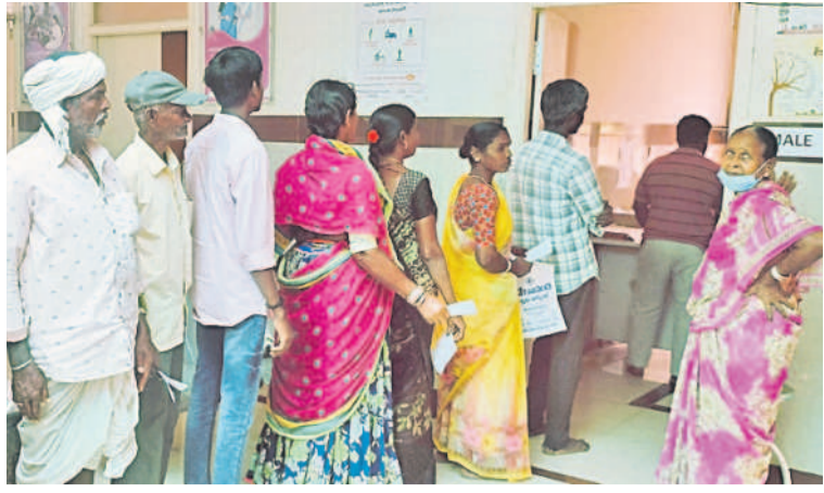
చికిత్స కోసం క్యూలో నిల్వన రోగులు