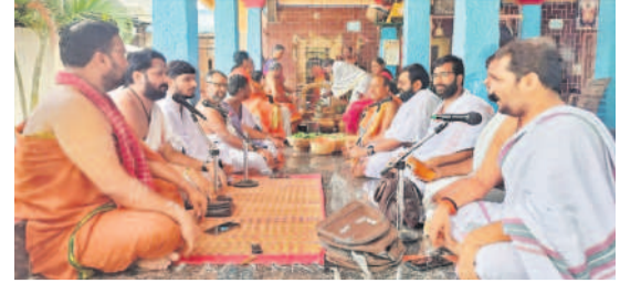
పాండురంగస్వామి ఆలయంలో భజనం చేస్తున్న భక్తులు

మర్యాద, జూలై 15: ప్రసిద్ధ దైవశైత్రం మర్యాద పాండురంగస్వామి ఆలయంలో ఆశాఢ మహోత్సవ వార్షిక భాగంగా సోమ వారం భవానీసమేత రామ లింగేశ్వర స్వామికి వేదపం దీక్షలు మంత్రోచ్ఛనాల మధ్య శతరుద్రాభిషేకాన్ని వైభవంగా నిర్వహించారు. హైదరాబాద్ నల్లకుంట్ల ప్రాంతానికి చెందిన భక్తులు ఉదయం 8 గంటల నుంచి సాయంత్రం ఆరు గంటల వరకు హాజరై భజనం చేశారు.