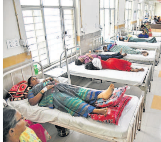
నిర్దిష్ట ప్రభుత్వ జనరల్ దవాఖానల్లో జ్వరం, ఇతర వ్యాధులతో చికిత్స పొందుతున్న పేషంట్లు

చేర్యాల, జూలై 15: చేర్యాల ప్రాంత ప్రజలకు సర్కారు వైద్యం సక్రమంగా అందడం లేదు. రోజూ వందల సంఖ్యలో ప్రజలు సర్కారు దవాఖానకు వైద్య సేవ కోసం వస్తున్నారు. కానీ వారికి సేవలు అందించేందుకు సర్కారు నియమించిన వైద్యులు అందుబాటులో ఉండడం లేదు. వారంతో మూడు రోజులు మాత్రమే సైట్ను ఉంటున్నారని ఆరుగురు వైద్యులు ఉన్నప్పటికీ రోజూ వారికి ఏదీ లేకపోవడం కట్టేసినట్లుగా ఉంది. 24 గంటలపాటు వైద్యం అందించాల్సిన వైద్యులు వంతులవారీగా విధులు నిర్వహిస్తున్నా సందర్భం కాబట్టి వారికి వైద్యం చేయడానికి అవకాశం లేదు. వారకాలం సీజనల్ వ్యాధులతో నిత్యం చేర్యాల దవాఖానకు జ్వరం, వంతులు, విరోచనాలు, నొప్పులతో ప్రజలు వస్తున్నారు. ఉదయం 9 నుంచి 2 గంటల వరకు ఔట్ పేషంట్లు, ఉదయం నుంచి సాయంత్రం వరకు అత్యవసర సేవలకు వైద్యులు నిత్యం అందుబాటులో ఉంటారు. కానీ ఇందుకు భిన్నంగా దవాఖాన కొనసాగుతున్నది. పట్టణంతోపాటు చేర్యాల, కొమ్మరవెల్లి, మద్దూరు, ధూళిమిట్ట మండలాలకు చెందిన ప్రజలు వైద్యం కోసం చేర్యాల దవాఖానకు వస్తున్నప్పటికీ వారికి సేవలు సక్రమంగా అందడం లేదు. రోజూ వారికి ఒకే వైద్యుడు ఉంటున్నాడని ప్రజలు అరోపిస్తున్నారు.