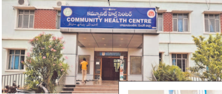
రామాయంపేట సీహెచ్సీ దవాఖాన

రామాయంపేట సీహెచ్సీలో రోజుకు రెండువందల ఔట్ పేషంట్లు