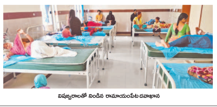
విషజ్వరాలతో నిండిన రామాయంపేట దవాఖాన

రామాయంపేట, జూలై 15: ఒకప్పుడు వైద్యులు అందుబాటులో లేక దవాఖానల్లో ప్రజలు తీవ్ర ఇబ్బందులు పడేవారు. కేసీఆర్ ప్రభుత్వం వచ్చిన తర్వాత ప్రతి పల్లెటూరునూ, మండల కేంద్రాల్లోనూ ప్రజలకు వైద్య సేవలు అందాలనే కృతనిశ్చయంతో ప్రభుత్వ దవాఖానల్లో సకల సదుపాయాలు కల్పించి, సరిపడా వైద్యులను, సిబ్బందిని నియమించడంతోపాటు అన్ని రోగాలకూ మందులను అందుబాటులో ఉంచినది. కానీ కొంగ్రెస్ ప్రభుత్వం దవాఖానల్లో మెరుగైన సౌకర్యాలు కల్పించడంలో విఫలమవుతున్నది. ప్రభుత్వ దవాఖానల్లో అందుబాటులో ఉన్న వైద్యులను, వైద్య సిబ్బందిని కోరికపడకుండా దండం ప్రజలకు వైద్యం అందకుండా పోతున్నది. మెడక్ జిల్లా రామాయంపేటలో 50 పడకల కమ్యూనిటీ హెల్త్ సెంటర్ ఉన్నది. అక్కడ కనీస సదుపాయాలు లేకపోవడంతోపాటు మందులు లేకపోవడంతో ప్రభుత్వ లక్ష్యం నీరుగారి పోతున్నది. ఈ దవాఖానకు రోజూ 200 మంది ఔట్