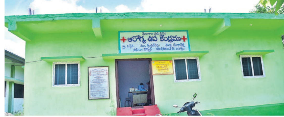
వేసుకునే మక్కల మందులు సైతం అందుబాటులో లేవు. ఉమ్మడి జిల్లాలోని చాలా పరకు ప్రభుత్వ ఆసుపత్రిలది దాదాపు ఇదే పరిస్థితి.

సీజనల్ వ్యాధులతో దవాఖానాల్లో పెరిగిన ఓపీ రద్దీకి తగ్గట్టుగా మందులు లేక అవస్థలు పడుతున్న రోగులు