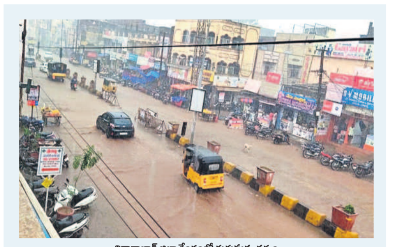
వికారాబాద్ జిల్లా కేంద్రంలో కురుస్తున్న వర్షం