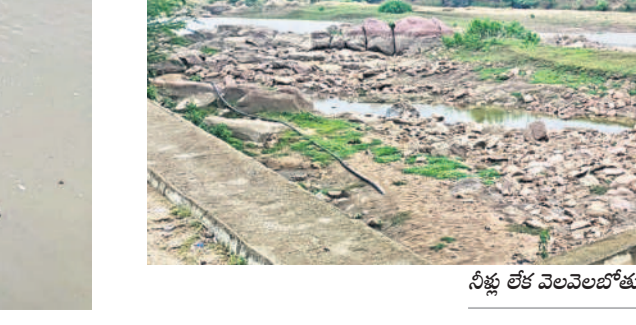
నీళ్లు లేక వెలవెలబోతున్న కప్పలవారు చెక్ డ్యాం