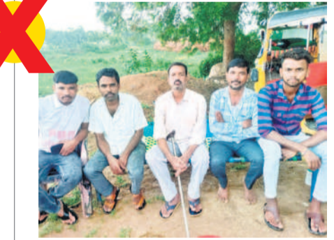
బాన్సువాడలో విలేజరులతో మాట్లాడుతున్న కాంగ్రెస్ నేతలు