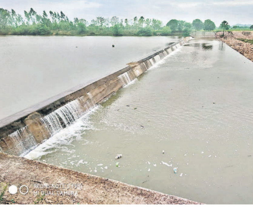
కప్పలవారు చెక్ డ్యాం పైనుంచి జాలువారుతున్న కాశ్యపం జలాల