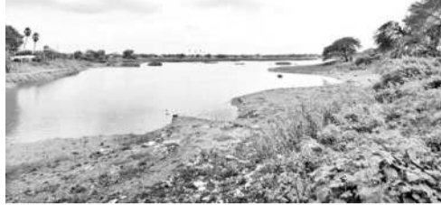
పగం కూడా నిండని గోమగోడ మండలం మొగిలిచర్లలోని వడమట్టి చెరువు

లో 25శాతంలోపే నీరు ఉంది. 70 చెరువులు, కుంటల్లో 25 నుంచి 50శాతం, 71 చెరువులు, కుంటల్లో 50 నుంచి 75, 18 చెరువుల్లో 75 నుంచి 100 శాతం నీరు ఉన్నట్లు నీటి సాగుదల శాఖ ప్రభుత్వానికి పంపినట్లు తెలిసింది. 50 నుంచి 75శాతం, 75 నుంచి 100 శాతం నీరు ఉన్న చెరువులు, కుంటల్లో గత యానం గి ఎన్నార్ల పేరు కాల్యాణ ద్వారా నీరు వచ్చినవేసిన సమాచారం. ఈ ఏడాది కొత్తగా వరద రాకపోవడంతో ఆయంట్లు సాగు ప్రస్థాపకంగా మారింది.