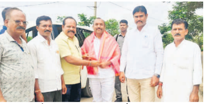
ఎమ్మెల్యే నవీన్ కుమార్ రెడ్డిని సన్మానిస్తున్న బీఆర్ఎస్ నాయకులు