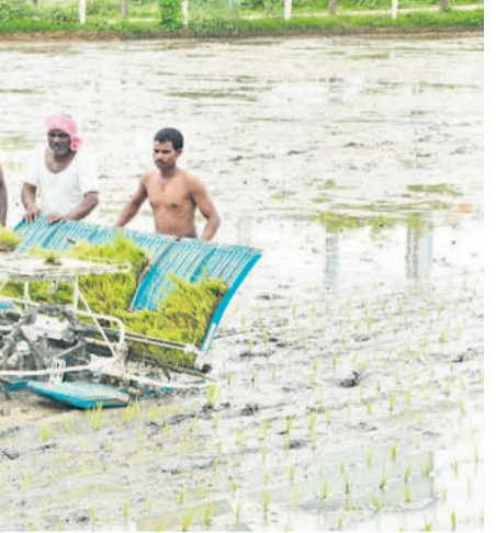
కోడూరులో ట్రాన్స్ ఫార్మర్ల మిషన్తో పరి నాట్లు వేస్తున్న రైతులు