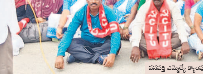
వనపర్తి ఎమ్మెల్యే క్యాంప్ కార్యాలయం ఎదుట ధర్నా చేస్తున్న ఆశకార్యకర్తలు