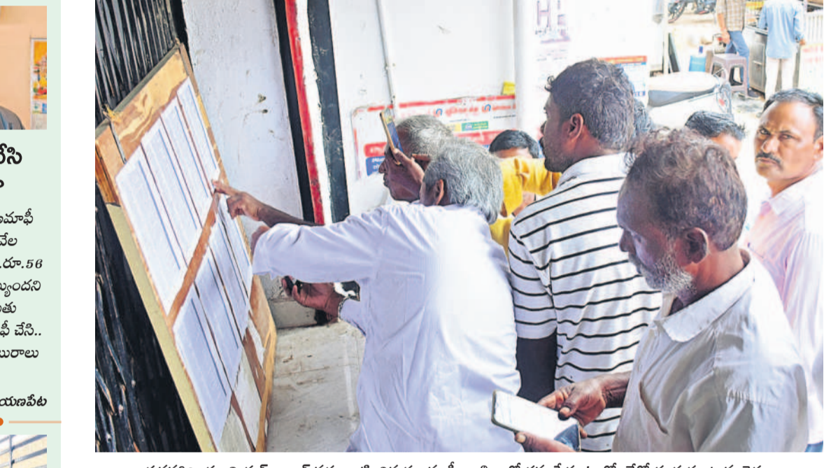
భువనగిరి యూనియన్ బ్యాంక్ వద్ద అందించిన రుణమాఫీ జాబితాలో తమ పేరు ఉందో, లేదో చూసుకుంటున్న రైతులు