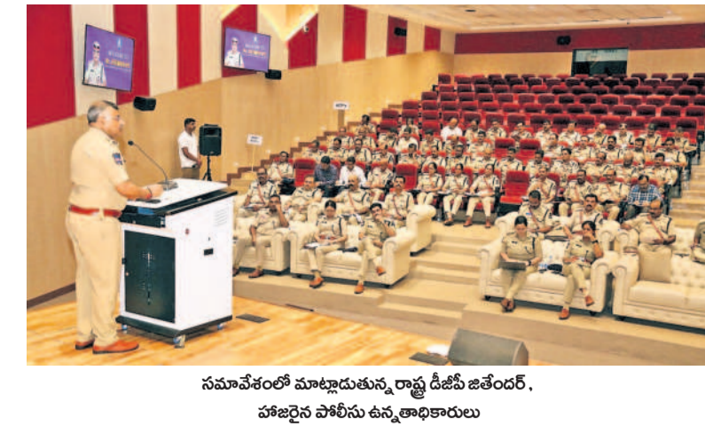
సమావేశంలో మాట్లాడుతున్న రాష్ట్ర డిజిపీ జితేందర్, హజియత్ పోలీసు ఉన్నతాధికారులు