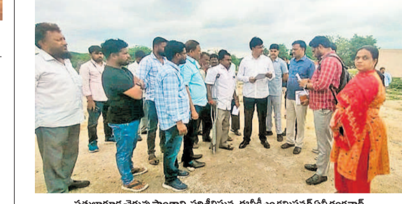
ఫతుల్లాగూడ చెరువు ప్రాంతాన్ని పరిశీలిస్తున్న ఈబీడిఎం కమిషనర్ ఏపీ రంగనాథ్