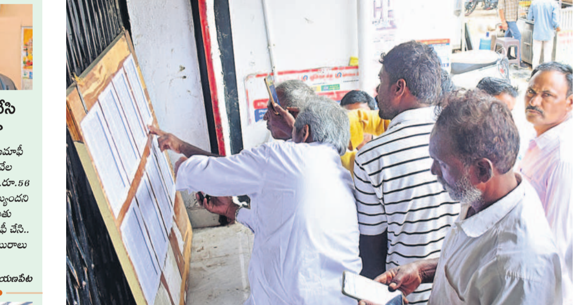
భువనగిరి యూనియన్ బ్యాంక్ వద్ద అందించిన రుణమాఫీ జాబితాలో తమ పేరు ఉందో, లేదో చూసుకుంటున్న రైతులు