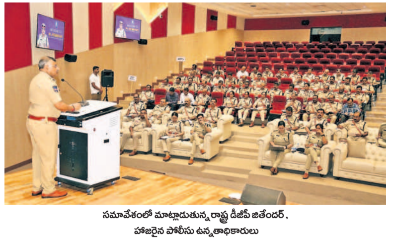
సమావేశంలో మాట్లాడుతున్న రాష్ట్ర డిజిపీ జితేందర్, హజిరైన పోలీసు ఉన్నతాధికారులు