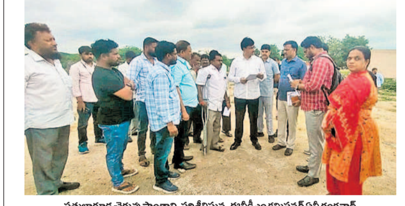
ఫతుల్లాగూడ చెరువు ప్రాంతాన్ని పరిశీలిస్తున్న ఈవీడిఎం కమిషనర్ ఏవీ రంగనాథ్