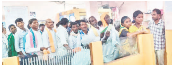
సింకొండలోని బ్యాంకులో క్యూలో నిలబడిన రైతులు

తగ్గరలో జిల్లాలో ముఖ్యమంత్రి రేవంత్ రెడ్డి పర్వతనుకు ఏర్పాటు చేయాలని ఆదేశించారు. గంటల తరబడి క్యూలో నిలబడి వివరాలు తెలుసుకున్నారు.