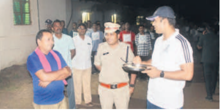
శిక్షణ కేంద్రంలో ఆహారాన్ని పరిశీలిస్తున్న ఎస్సీ గౌడ్ ఆలం

ఎదులాపురం, జూలై 19 : ఆదిలాబాద్ పట్టణంలోని పోలీస్ శిక్షణ కేంద్రాన్ని శుభ్ర వారం ఆదిలాబాద్ జిల్లా ఎస్సీ గౌడ్ ఆలం ఆకస్మికంగా తనిఖీ చేశారు. ముందుగా కానిస్టేబుల్లకు వర్తించే ఆహారాన్ని స్వయంగా తిని పరిశీలించారు. నాణ్యమైన వస్తువులతో రుచికరమైన ఆహారాన్ని పంపాలని నిర్దేశాలకులకు సూచించారు. శిక్షణ కాలంలో శారీరక దారు ధ్యోతో పాటు, క్రమశిక్షణ పెంపొందించుకోవాలని కానిస్టేబుల్లకు సూచించారు. ఆయుధాలను వాడే పద్ధతి, కేసుల పరిశోధనలో సాంకేతిక పరిజ్ఞానం ఉపయోగాన్ని తెలుసుకోవాలన్నారు. నూతన చట్టాలపై ప్రత్యేక తరగతుల కల్పిస్తామని సూచించారు. ఎస్సీ వెంట శిక్షణ కేంద్రం ప్రిన్సిపాల్ నీ సమయం జూన్ రావు, రిజిస్ట్రార్ సబ్ ఇన్స్పెక్టర్ రాజ్ కే సిబ్బంది తదితరులు పాల్గొన్నారు.