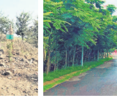
ముత్తా(తీ) గ్రామంలో గ్రీన్ ఇండియా చాలెంజర్ భాగంగా మొక్కలు నాటినప్పటి ఫాటో