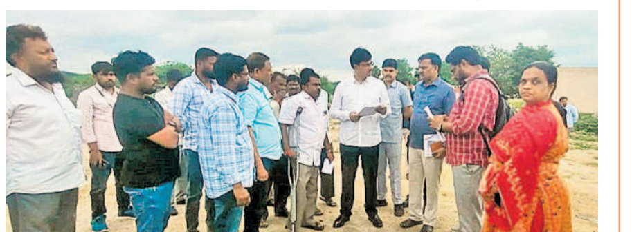
ఘట్టాగూడ చెరువు ప్రాంతాన్ని పరిశీలిస్తున్న కనీషిం కమిషనర్ ఏవీ రంగనాథ్

మన్యూరాబాద్, జూలై 19: చెరువుల పరిరక్షణకు చెరువు కట్టా విషయంపై మద్దతు, రంగారెడ్డి జిల్లా రెవెన్యూ, మున్సిపల్ అధికారులను ప్రశ్నించారు. గతంలో చెరువు పరిరక్షణ కోసం చుట్టూ చేసిన షెన్సింగ్ ను తొలగించి తప్పకుండా సర్వే సంబంధిత ప్రభుత్వ స్థలాలను కట్టా చేస్తున్నారని స్థానికులు తెలిపారు. ప్రభుత్వ స్థలాల కట్టాకు గురవుతుంటే మీరు ఏం చేస్తున్నారని అబ్దుల్ హామీద్ రెవెన్యూ అధికారులను, ఇరిగేషన్ చేశారు. ఈ మేరకు శుభ్రవారం సదరు ప్రాంతానికి ఈవీ డి.ఎం కమిషనర్ ఏవీ రంగనాథ్ వెళ్లి పరిశీలించారు. ఘట్టాగూడ చెరువు ఎవీ.ఎల్.పి.లో కోంతమంది అక్రమ లే అవుట్ చేసి ఇండ్లు కట్టి ప్రజలకు వికలంబు న్నారని స్థానికులు ఫిర్యాదు చేయడంతో సదరు ప్రాంతానికి విచ్చేసి ఆరోపణలు ఎదుర్కొంటున్న వ్యక్తి వద్ద ఉన్న డాక్యుమెంటును పరిశీలించారు.