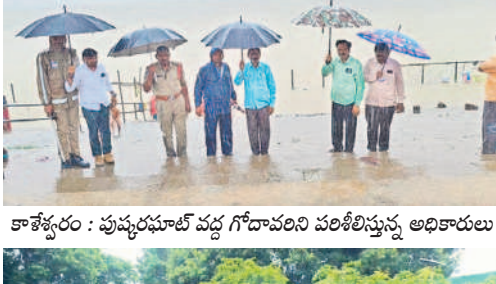
కాశ్యపం : పుష్కరసూట్ వద్ద గోదావరిని పరిశీలిస్తున్న అధికారులు