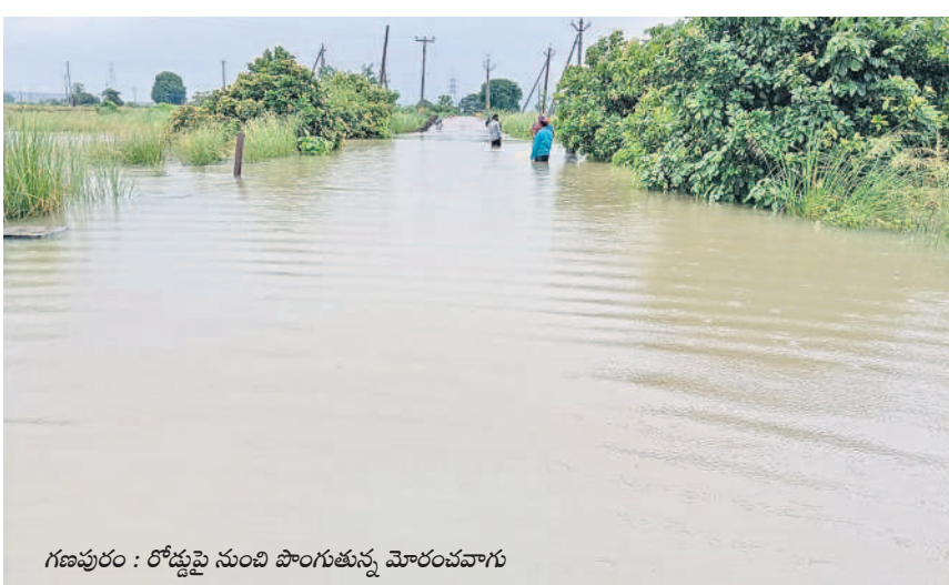
గణపూరు : రోడ్డుపై నుంచి పొంగుతున్న మోరంపాగు