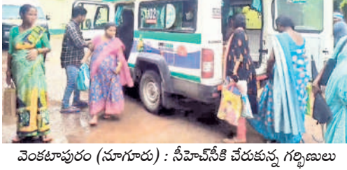
వెంకటాపురం (నూగూరు) : సీహెచ్.ఎస్.సీ చేరుకున్న గర్భిణులు