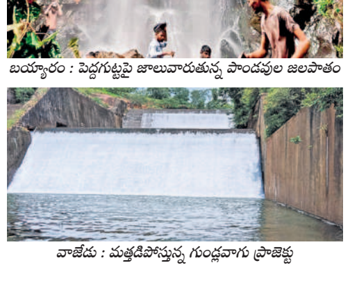
వాజేడు : మత్తడిపోస్తున్న గుండ్లవారు ప్రాజెక్టు