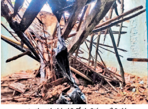
కాటూరు : శంకరవల్లిలో కూలిన ఇంటి పైకప్పు