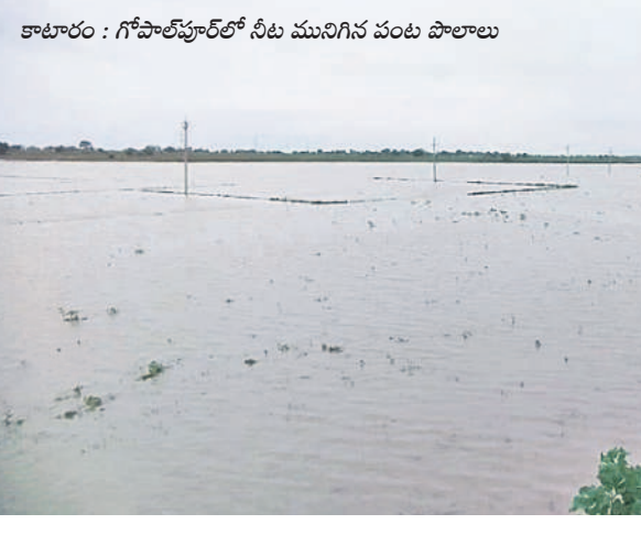
కాటూరు : గోపాల్పూర్ లో నీటి మునిగిన పంట పొలాలు