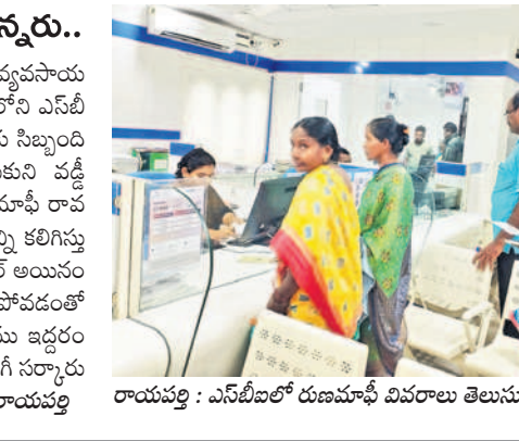
రాయపల్లి : ఎస్.బీ.బి.ఎల్. రుణమాఫీ వివరాలు తెలుసుకుంటున్న రైతులు