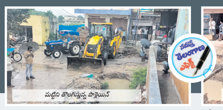
మట్టిని తొలగిస్తున్న పాకెయిన్

ఎల్లారెడ్డి, జూలై 20 : ఎల్లారెడ్డి మండలంలో శుక్రవారం రాత్రి 10 నుంచి తెలుగుదేశం ముసురు కురుస్తున్నది. దీంతో శనివారం పట్టణమంతా తెలుగుదేశం గాంధారిగా మారింది. చల్లటి గాలితోపాటు ముసురు చేయడంతో చిరు వ్యాపారులు, ప్రజలు ఇబ్బందులు ఎదుర్కొన్నారు. వర్షం కోసం ఎదురుచూస్తున్న రైతులకు చిరుజల్లులు ఊరటనిచ్చాయి.