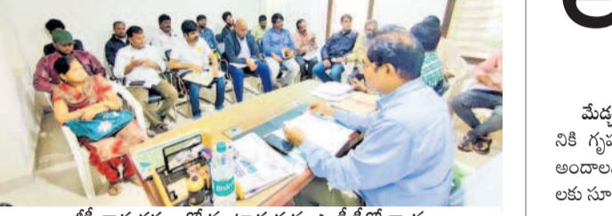
జీవీ కార్యదర్శులతో మాట్లాడుతున్న ఎంపీడివో గృహా

జీవీ కార్యదర్శులతో మాట్లాడుతున్న ఎంపీడివో గృహా జీవీ కార్యదర్శులతో మాట్లాడుతున్న ఎంపీడివో గృహా