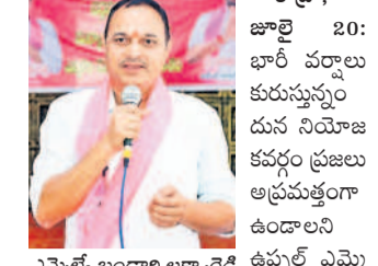
ఎమ్మెల్యే బండాల లక్ష్మారెడ్డి ఉప్పల్ ఎమ్మెల్యే బండాల

వర్షాలతో ప్రజలు అప్రమత్తంగా ఉండాలి వర్షాలతో ప్రజలు అప్రమత్తంగా ఉండాలి