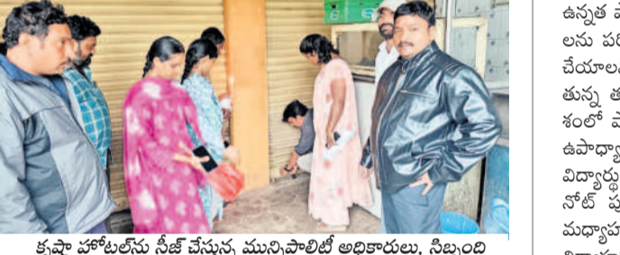
కృష్ణా హోటల్స్ ను సీజ్ చేస్తున్న మున్సిపాలిటీ అధికారులు, సిబ్బంది

కలుషిత ఆహారం పెడితే చట్టబంధమైన చర్యలు కలుషిత ఆహారం పెడితే చట్టబంధమైన చర్యలు