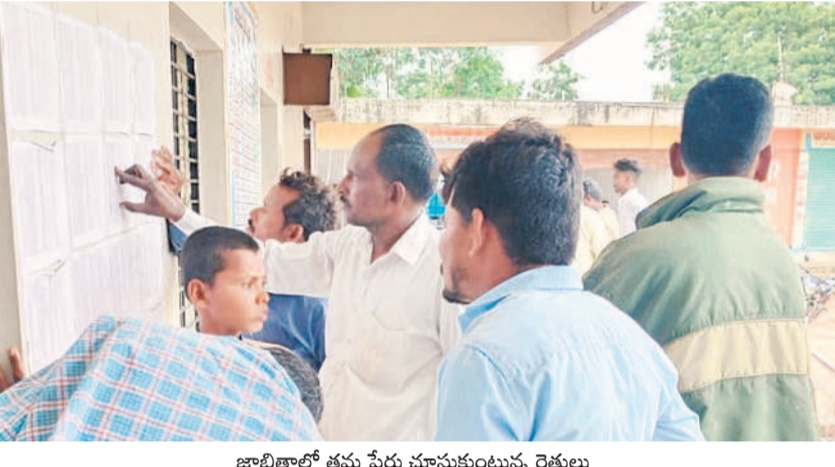
జాబితాలో తమ పేర్లు చూసుకుంటున్న రైతులు

• వ్యవసాయ కార్యాలయాలు, బ్యాంకుల చుట్టూ రైతుల ప్రదక్షిణలు గట్టు, జూలై 20 : కాంగ్రెస్ ప్రభుత్వం చేపట్టిన రుణ మాఫీ పథకం అయోమయంగా మారింది. ఒకవైపు రూ. లక్షలకు పైగా రుణాలను మాఫీ చేశామని, రైతుల అకౌంట్లలో నిధులు జమ చేశామని ప్రభుత్వం చెబుతుంది. కాగా రూ. లక్షలకు పైగా రుణం ఉన్న రైతులు తమకు రుణమాఫీ కాలేదని వ్యవసాయ కార్యాలయాలు, బ్యాంకుల చుట్టూ తిరుగుతున్నారు. అయితే ఎవరూ రైతులకు సరైన సమాధానం చెప్పలేకపోతున్నారు. గట్టు మండలంలో టీఎస్పీఎస్ కార్యాలయం ఒక్కటి ఉన్నది. దీంతో పంపిణీ రుణాల తీసుకున్న రైతులు 824మంది ఉన్నారు. ఈ క్రమంలో రూ. లక్షలకు పైగా రుణం తీసుకున్న రైతులు 706మంది ఉన్నారు. వీరిలో రూ. 1.50లక్షలకు పైగా రుణం తీసుకున్న వారు 72మంది ఉండగా, రూ. 2లక్షలకు పైగా రుణం తీసుకున్న రైతులు మరో 23మంది ఉన్నారు. కాగా రూ. లక్షలకు పైగా రుణం తీసుకున్న వారు 706మందిలోకి వలం 282మంది రైతులకు మాత్రమే రుణమాఫీ అయినట్లు అధికారులు చెబుతున్నారు. మిగిలిన 424మంది రైతులు రుణమాఫీ కాక అధికారుల చుట్టూ ప్రదక్షిణలు చేస్తున్నారు. గట్టు ఎన్టీఐ, మావర్ర అండ్ డ్రాఫ్టింగ్, సింగనూరు ఏపీజీసీబీలో కూడా ఇదే పరిస్థితి ఉంది. గందరగోళంగా ఉండని రైతులు వాపోతున్నారు.